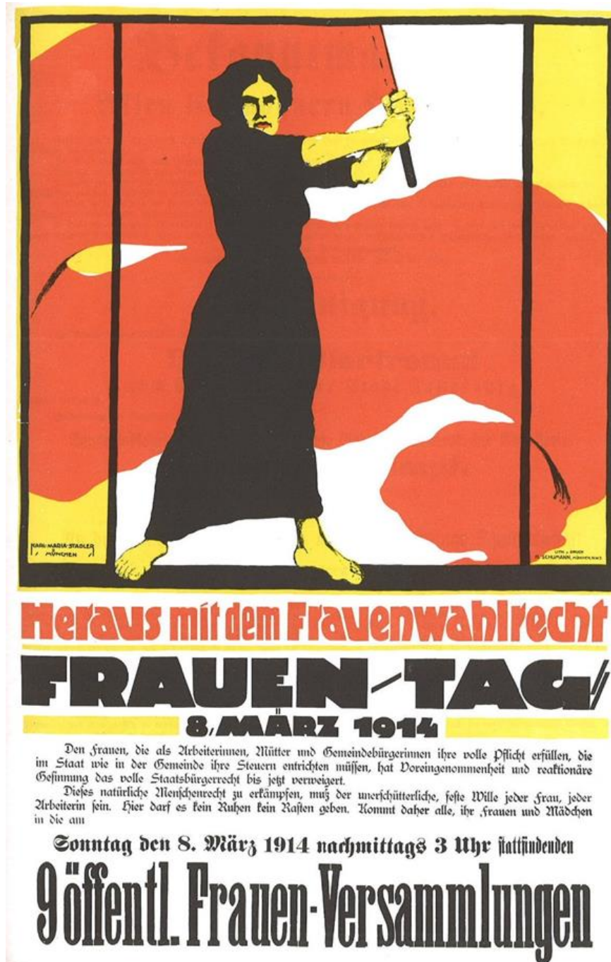
„Poster for Women's Day, March 8, 1914, demanding voting rights for women. ” 3

So steht es auf diesem Plakat zum 8.3.1914, vor dem Ersten Weltkrieg.