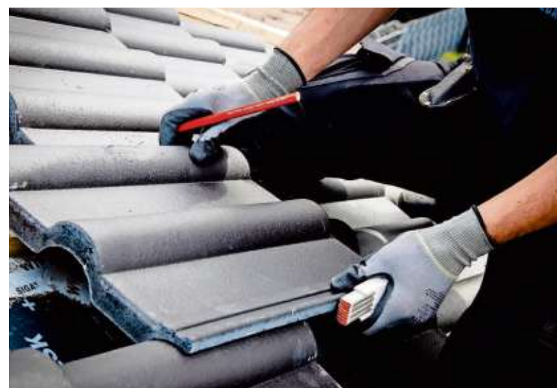
Mehr Geld für die „höchsten Jobs“. Für Dachdecker steigen zum neuen Jahr die Löhne.

Messlatte für Fachkräfte bleibe aber der Tariflohn. Der liegt aktuell bei 19,12 Euro pro Stunde. „Darunter sollte keiner arbeiten gehen, der sein Fach gelernt hat und Tag für Tag gute Arbeit macht“, sagt Nicklas. Anspruch auf die tarifliche Bezahlung haben Gewerkschaftsmitglieder, deren Firma Mitglied in der Dachdeckerinnung ist. Zum Januar steigt außerdem der Mindestlohn für einfache Hilfsarbeiten. Ungelernte kommen jetzt auf einen Stundenlohn von mindestens 12,40 Euro.