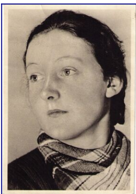
Cato Bontjes van Beek.

Der Zeitpunkt der Ausstrahlungen ist derweil mit Bedacht gewählt worden, denn am 14. November 1920, also vor 100 Jahren, wurde die bekannte Widerstandskämpferin Cato Bontjes van Beek in Bremen geboren. Sie entstammte einer Familie von Malern, Musikern und Keramikern, wuchs in Fischerhude auf und schloss sich 1941 in Berlin der Roten Kapelle an, einer der größten Widerstandsgruppen im Dritten Reich, die zugleich den größten Frauenanteil besaß. Wie Sophie Scholl von der Weißen Rose in München entwarf und verteilte Cato Flugblätter, wurde daraufhin zum Tode verurteilt und nach fast zehnmonatiger Haft am 5. August 1943 als 22-Jährige in Berlin-Plötzensee hingerichtet. Ihre Briefe aus der Haft gehören zu den eindrucksvollsten Zeugnissen einer politischen Gefangenen während der NS-Zeit.