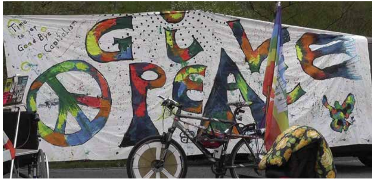
Fahrradmarathon Stopp Air Base Ramstein 30.04.2021