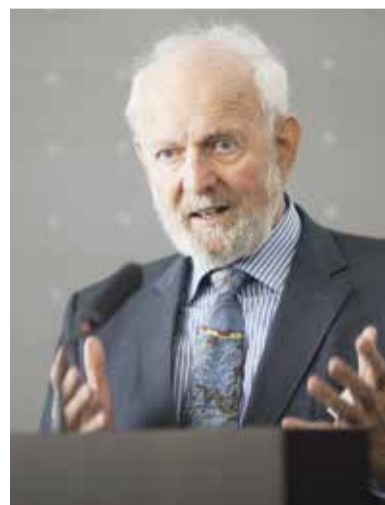
Ernst Ulrich von Weizsäcker

Dass solche Auslandseinsätze in Zukunft zunehmen, befürchte ich angesichts des wachsenden deutschen Rüstungshaushalts und der Programme fast aller Parteien. Lieber sähe ich, dass die Bundesregierung auf Gerechtigkeit setzt, teilt und sich so Freundschaften mit anderen Ländern bilden. Ausgaben für die Armeen schaffen (menschliche) Sicherheit.