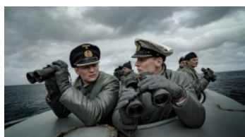
„Das Boot“ – Geschichtsklitterung in Neuerfilmung?

40 Jahre später bietet das ZDF eine neue Serie als „Event“ an. Die achteilige erste Staffel ist 2018 trotz durchwachsender Kritik erfolgreich genug, um eine zweite und dritte Staffel in Auftrag zu geben. Die Handlung ist in das Portugal der Salazar-Diktatur im Jahr 1942 verlegt. Portugal bleibt im Zweiten Weltkrieg neutral, Spione aller Mächte beschatten und ermorden einander hier. Zur gleichen Zeit machen neue Kriegstechnologien die deutschen U-Boote von Jägern zu Gejagten. Kurzum: Das Kriegsbild ist nun ganz und gar der internationalen Seriendramaturgie unterworfen. Und noch weniger als mit dem Original hat das alles mit einem realen Krieg in einer realen Welt zu tun.