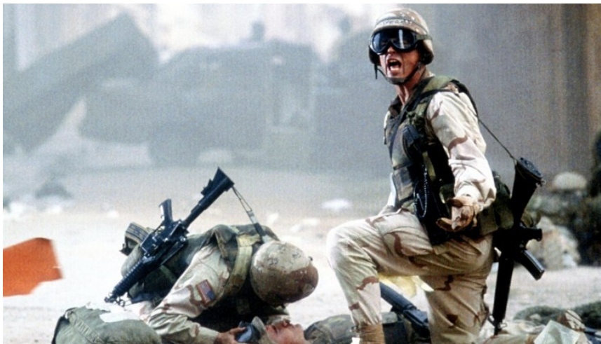
Szene aus dem Kinofilm „Black Hawk Down“

Hören Sie unsere Beiträge in der DfJ Audiothek