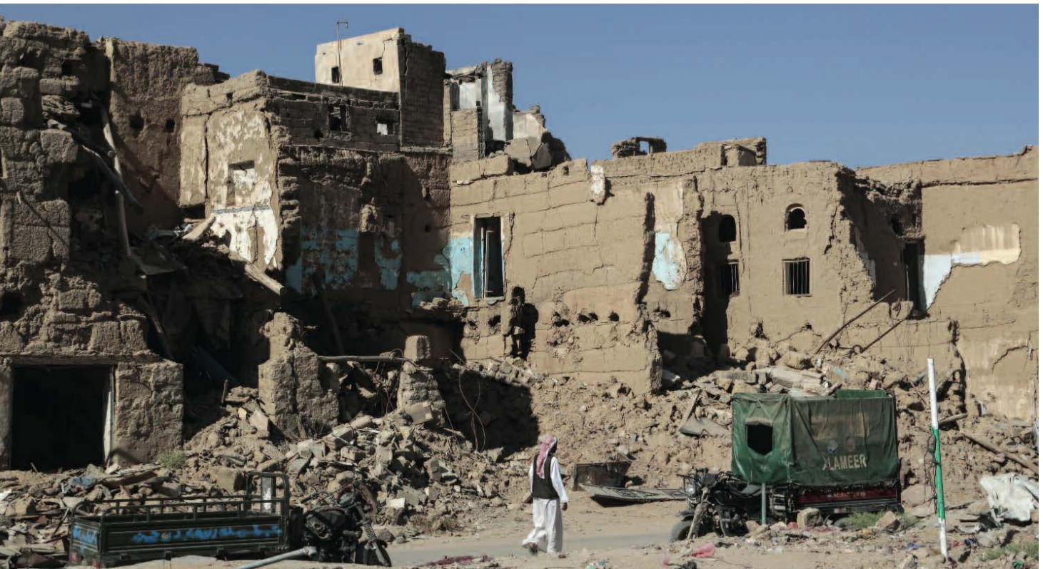
Wohnhäuser in Sa'da (Jemen), die durch Luftschläge der von Saudi-Arabien und Vereinigten Arabischen Emiraten geführten Militärallianz zerstört wurden. Durch diese völkerrechtswidrigen Angriffe sind mehr als 20.000 Zivilist:innen getötet und verstümmelt worden, darunter viele Kinder.