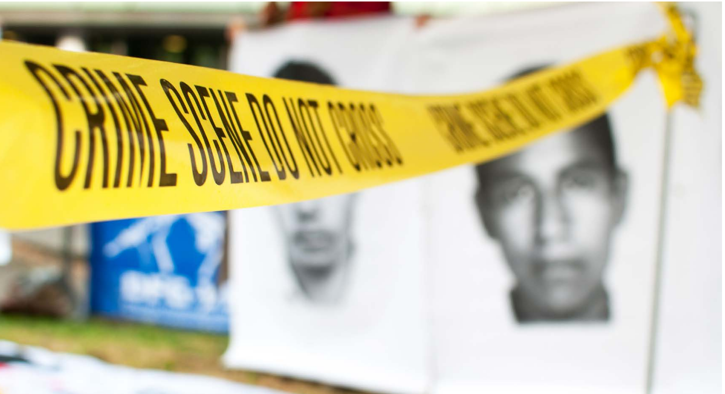
Mahnwache in Stuttgart 2018, Prozessaufakt gegen Heckler und Koch wegen illegaler G36-Exporte nach Mexiko. Eine Nebenklage der Angehörigen der Opfer wurde nicht zugelassen. Illegal gelieferte G36-Gewehre wurden beim sog. Ayotzinapa-Massaker eingesetzt, bei dem 43 Student:innen ermordet wurden.

Weitere Rechtszugangshürden werden erkannt und erfreulicherweise eine Durchsetzung der Ansprüche Betroffener mittels prozessstandschaftlicher Vertretung von anerkannten Verbänden soll laut Eckpunktentwurf ermöglicht werden. 51 Dies ist wichtig, da Betroffene überwiegend Ausländer:innen im Ausland sein werden und daher bei einer Geltendmachung von Ansprüchen vor Gerichten in Deutschland vor einer Vielzahl an Hürden stehen. Ein Verbandsklage-recht im oben genannten Sinne wird hierdurch nicht geschaffen.