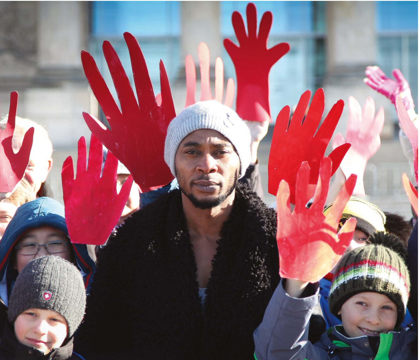
Rote-Hand-Aktion am 12. Februar gegen den Einsatz von Kindersoldat:innen und gegen Waffenexporte. Jedes Jahr protestieren tausende Schüler, Schülerinnen und Erwachsene in vielen Ländern, machen Sie mit! www.redhandday.org