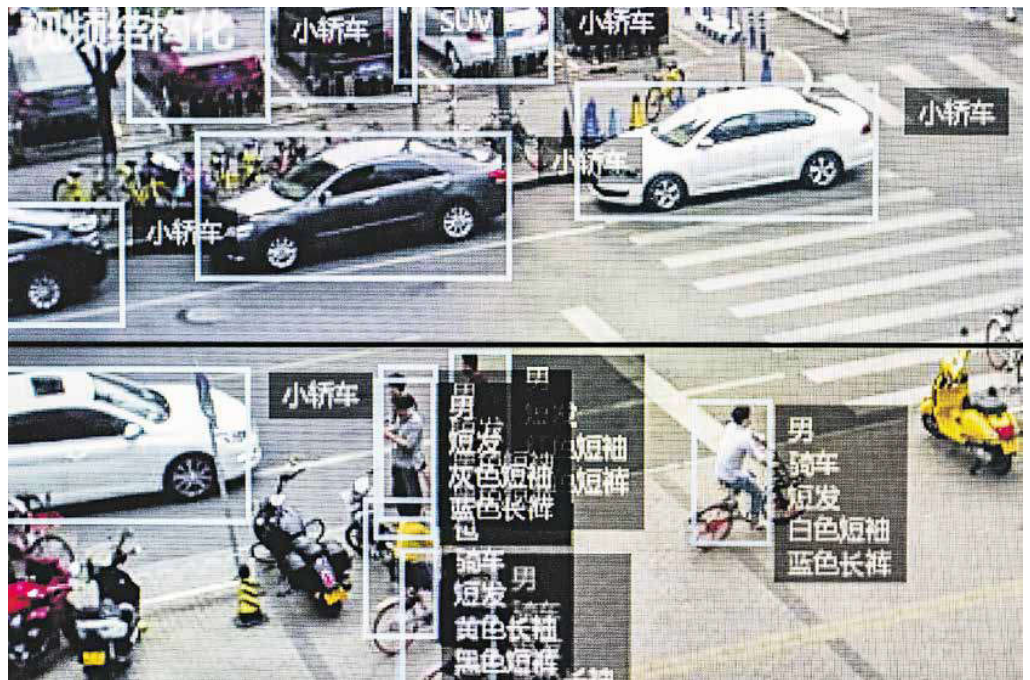
Geschlecht, Haarfarbe, Kleidung, Automarke, auffälliges Verhalten, vieles erkennt die Software Face++ der chinesischen Firma Megvii mittlerweile mit hoher Präzision. Eine große Rolle spielt dabei die Weiterentwicklung der künstlichen Intelligenz, die von der chinesischen Regierung als zentrale Zukunftstechnologie stark gefördert wird. Die Vision dahinter: Die Überwachung von 1,4 Milliarden Chinesen