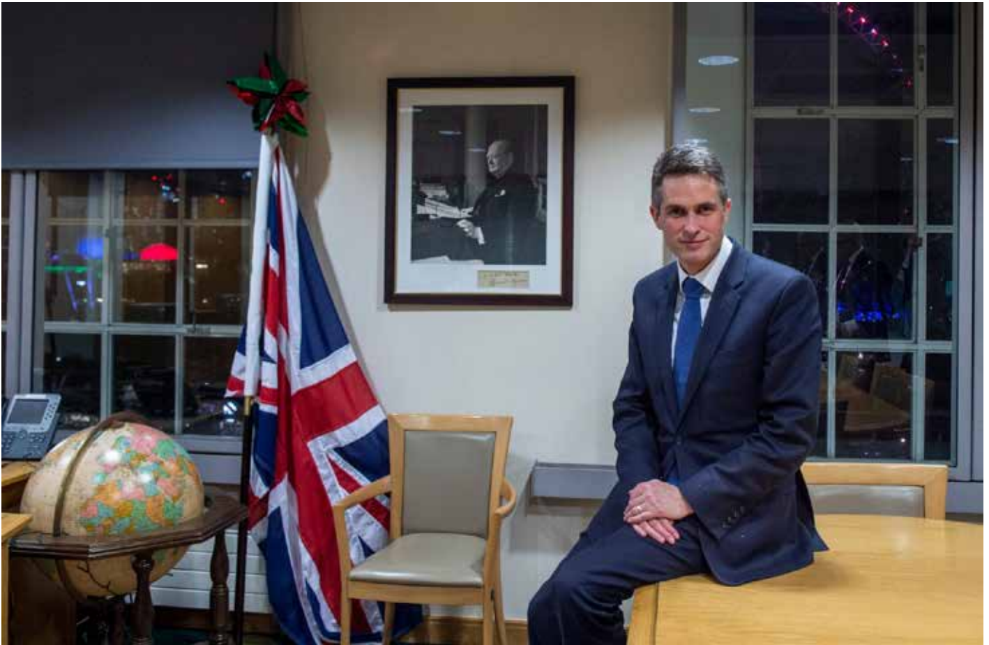
Pose und „Beiwerk“, mit dem sich Verteidigungsminister Gavin Williamson für sein Interview im Independent ablichten ließ. Dieses Bild zeigt die Onlinefassung, Lesern der Printausgabe wurde der Globus vermutlich aus Platzgründen erspart. Quelle: We are opening new overseas bases to boost Britain, The Independent, 30.12.2018.

Bemerkenswert – und ebenfalls bereits von der HJS gefordert – ist auch die Aussage, die britische Basis Duqm im Oman als Sprungbrett für den Indo-Pazifik – insbesondere für Flugzeugträger – nutzen zu wollen: „Wir werden die Kette unserer globalen Logistikstützpunkte und Militärbasen strategischer nutzen [...], um dauerhaft harte und weiche Macht projizieren zu können. Die Hafenanlagen in Duqm im Oman sind groß genug, um unsere Flugzeugträger unterstützen zu können. [...] Und heute kann ich ankündigen, dass die erste Einsatzmission der HMS Queen Elizabeth das Mittelmeer, den Mittleren Osten und die pazifische Region einschließen wird.“ (GW2)