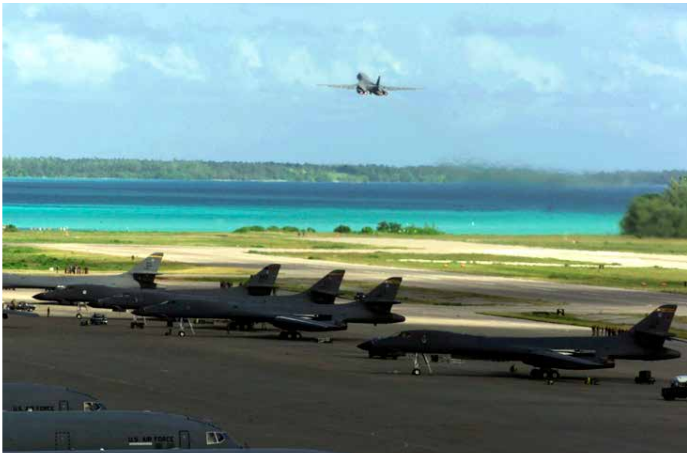
Auf Diego Garcia stationierte Kampfflugzeuge.