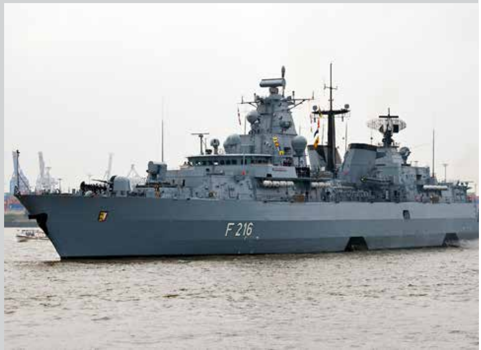
Fregatte Schleswig-Holstein.

Es gehört nicht viel Phantasie dazu, um sich vorzustellen, dass derlei Überlegungen, die kurz darauf auch von Kanzlerin Angela Merkel wohlwollend aufgegriffen wurden 9 , auch dazu dienen sollen, einen Keil in die anvisierte britisch-französische Entente zu treiben. Im Augenblick ist offen, wie sich die Angelegenheit weiter entwickeln wird, es lässt sich aber bislang zumindest noch nicht sagen, dass Deutschland mit dem Vorschlag für einen gemeinsamen Flugzeugträger in Paris offene Türen eingerannt wäre: „So weit sind wir noch nicht. Es gibt eine Vielzahl von Fragen“, sagte die französische Verteidigungsministerin Florence Parly unserer Partnerzeitung ‚Ouest-France‘. ‚Handelt es sich um den Bau eines Flug-