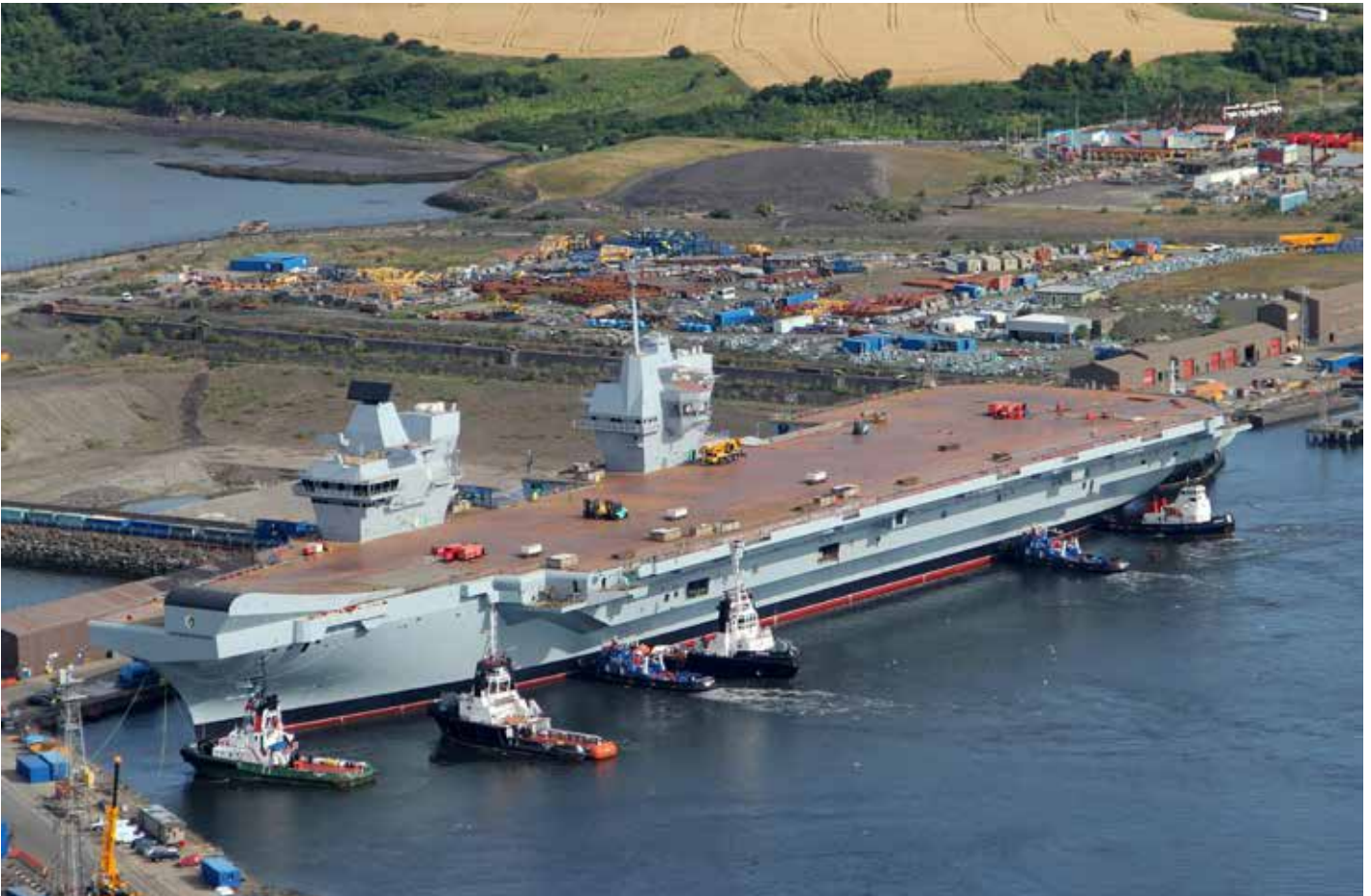
Der Flugzeugträger HMS Queen Elizabeth.

bestätigt wird: „Tatsächlich ist Großbritannien mit der Eröffnung einer neuen Marinebasis in Bahrain und einem Logistikstützpunkt im Oman schon seit einem Jahrzehnt dabei, sich ‚östlich von Suez‘ neu aufzustellen.“ (HJS2: 7)