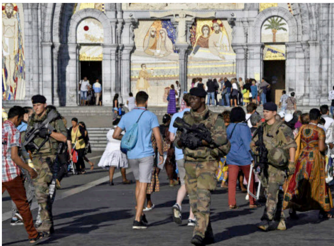
Wirkt die Anwesenheit von Militär beruhigend oder macht sie Angst? Hier Soldaten vor der Kathedrale von Lourdes in Frankreich am Montag.