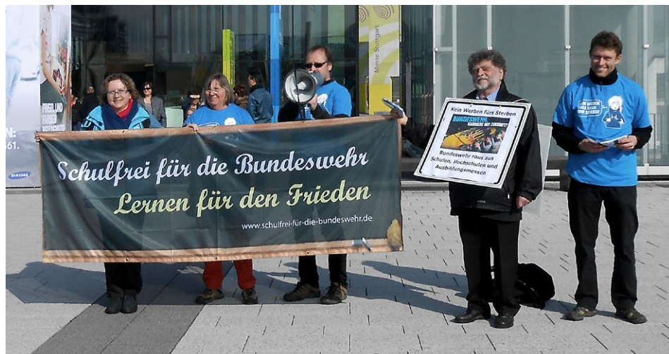
Auf der Bildungsmesse Didacta, warb die Bundeswehr. Die Friedensbewegung protestierte.

Die Kündigung der Kooperationsvereinbarung von oben und von unten steht im Mittelpunkt der Kampagne »Schulfrei für die Bundeswehr. Lernen für den Frieden«. Die Kampagne will bis zum Ende des Schuljahres 2015/16 möglichst viele Schulen dafür gewinnen, sich als bundeswehrfrei zu erklären. Dies geht nur mit einem sehr langen Atem.