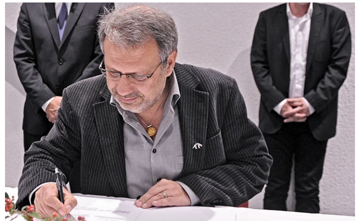
Im Haus der Wirtschaft in Stuttgart wurde die Erklärung vom Kultusminister und den Vertretern der gesellschaftlichen Gruppen feierlich unterzeichnet.