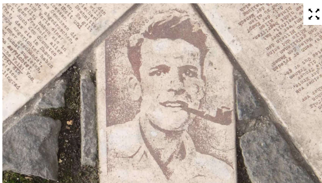
Ein Bodendenkmal vor dem Haupteingang der Münchner Universität erinnert an Christoph Probst.