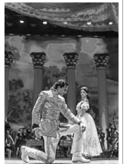
Glamourös: Sissi live als Tanztheater!

Spielzeiten vom 09.-11. Dezember 2014 Dienstag, Mittwoch, Donnerstag 19.30 Uhr und Mittwoch zusätzlich um 15.30 Uhr. Ticketpreise von 30,00 bis 62,00 Euro