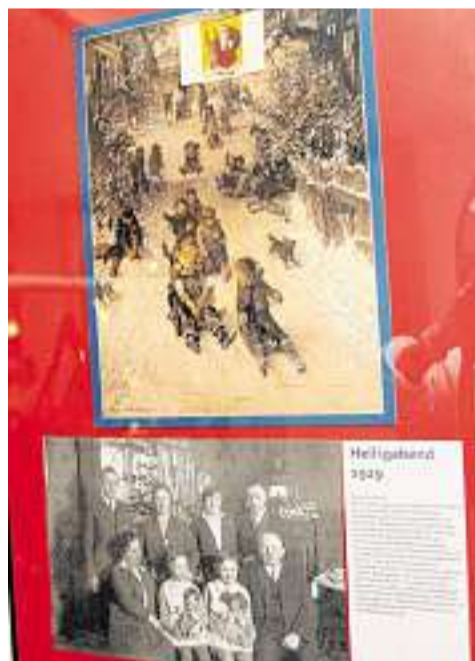
Aus dem Jahr 1929 stammen dieser Kalender und das Foto mit Info-Text.

Im Bürgerhaus Mahndorf, Mahndorfer Bahnhof 10, Telefon 48 58 15, kommt der Nikolaus am Dienstag, 6. Dezember, ab 16 Uhr zum Kindertag. Lieder singen oder Gedichte aufsagen für kleine Geschenke, Ponyreiten, Waffeln, Schmalzkuchen, Kinderpunsch und mehr für Kinder und deren Begleiter sind geplant.