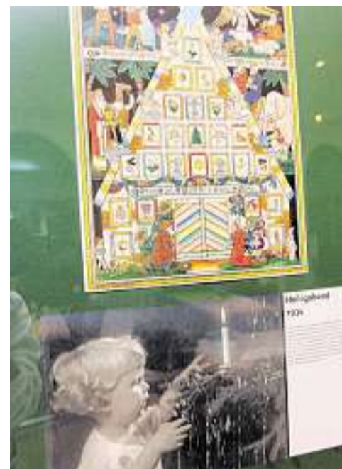
Ein Foto vom Heiligen Abend ergänzt den Kalender von 1934.