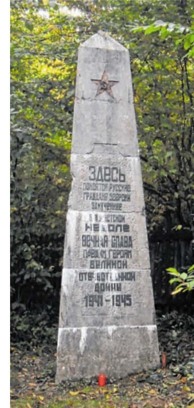
Auch der Obelisk muss dringend restauriert werden.

und sind willkommen auf dem Konto des Landesverbandes Deutsche Kriegsgräberfürsorge. IBAN DE67