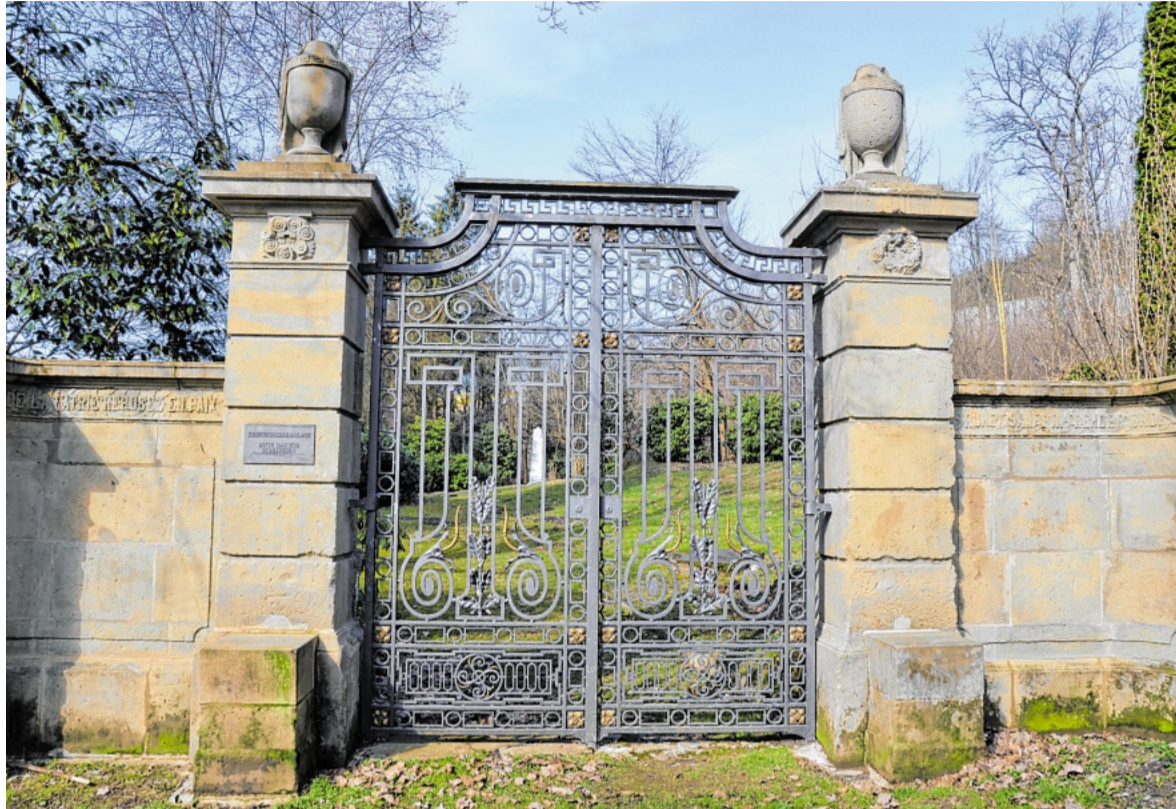
Der Franzosenfriedhof in der Fulmecke erhält eine Info-Tafel. Sie soll darüber informieren, dass 208 sowjetische Kriegsgefangene dort beerdigt liegen. Sie wurden in den letzten Kriegstagen in Warstein und Eversberg ermordet.

Etwa 1000 übernachteten in jenen Tagen in einem Durchgangslager in Warstein. Eine bedrohlich große Zahl. Die SS fürchtete Aufstände und Vergeltungsmaßnahmen. „Dezimieren“, lautete deshalb die Anweisung von Hans Kammler, SS-Obergruppenführer und General der Waffen-SS.