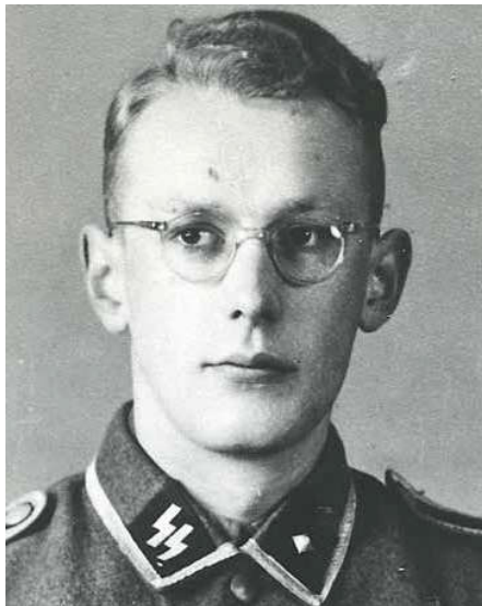
Oskar Gröning in den frühen 1940er Jahren ...

Um so wichtiger ist nun die BGH-Entscheidung im Fall Gröning. Die Vertreter der Nebenklage begrüßten den Beschluss. Endlich sei klar: „Auschwitz war ein Ort, an dem man nicht mitmachen durfte.“ (Az.: 3 StR 49/16)