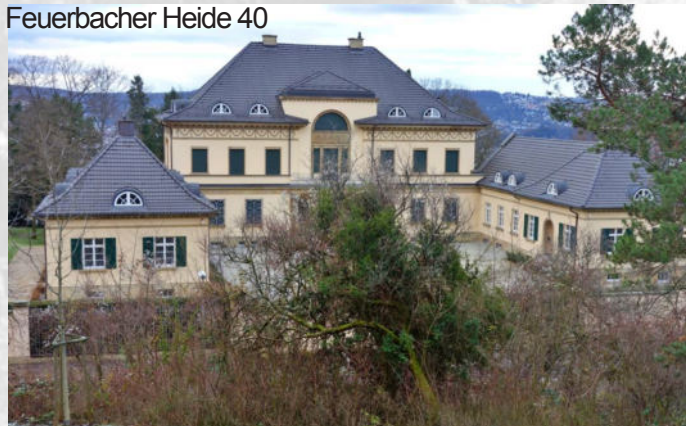
Feuerbacher Heide 40