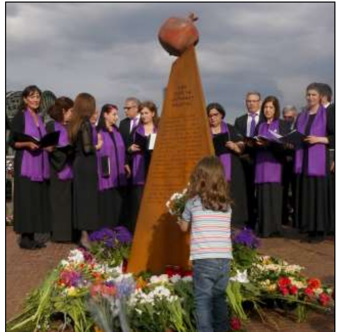
Blumen zum Gedenken an die ermordeten Armenier, niedergelegt am Völkermord-Mahnmal

„Die größte Gefahr ist Gleichgültigkeit; nicht zu sehen, dass eine Gefahr überhaupt existiert in Europa. Nein Geschichte wiederholt sich nicht. Aber wer sich nicht an die Vergangenheit erinnert, dem drohen immer neue Tragödien.“