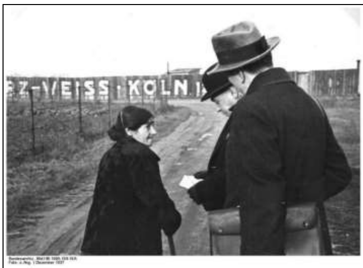
Sintezita und Kriminalbeamte auf dem Schwarz-Weiß-Platz in Köln-Bickendorf Dezember 1937

Hier wurden sie von der übrigen Bevölkerung abgesondert, nach rassistischen Kriterien erfasst und zu Zwangsarbeit gepresst. Von hier aus wurden sie im Mai 1940 über den Bahnhof Deutz-Tief in Ghettos und Vernichtungslager im besetzten Polen verschleppt. Nur wenige kamen zurück.