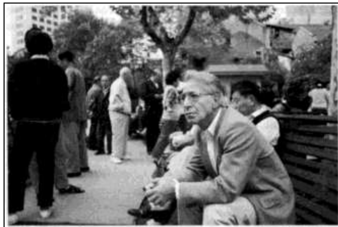
Peter Finkelgruen © Dietrich Schubert