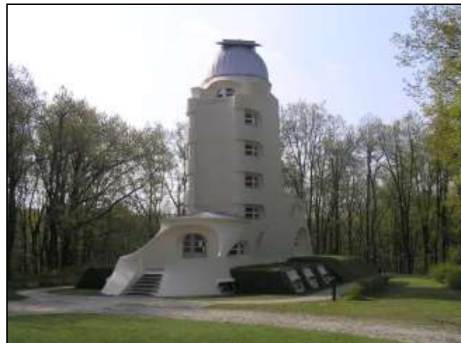
Das Observatorium „Einsteinturm“ vom Architekten Erich Mendelsohn in Potsdam, erbaut zwischen 1920 und 1922 im „Wissenschaftspark Albert Einstein“

Ausstellung und Katalog sind das Ergebnis einer Kooperation des Bauhaus Centers Tel Aviv, der Alten Synagoge Essen und des Moses Mendelssohn Zentrums Potsdam.