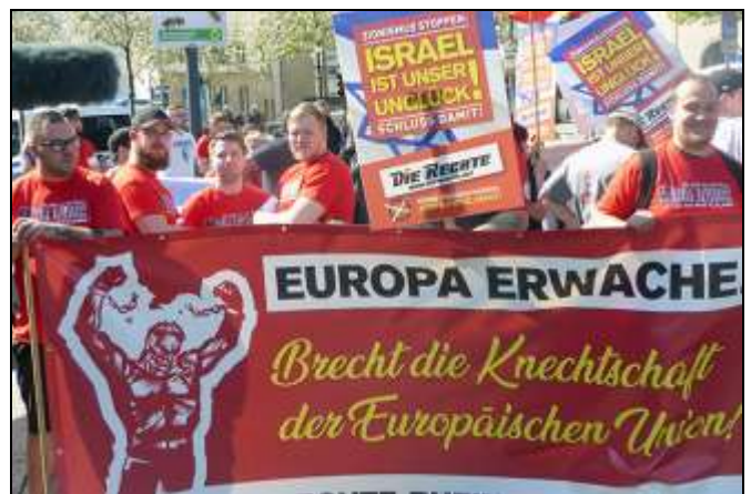
Mit Anti-Israel-Plakaten demonstrieren Neonazis in Wuppertal

Eine ausführlichere Textversion ist auf dem Internet-Portal "hagalil" erschienen: