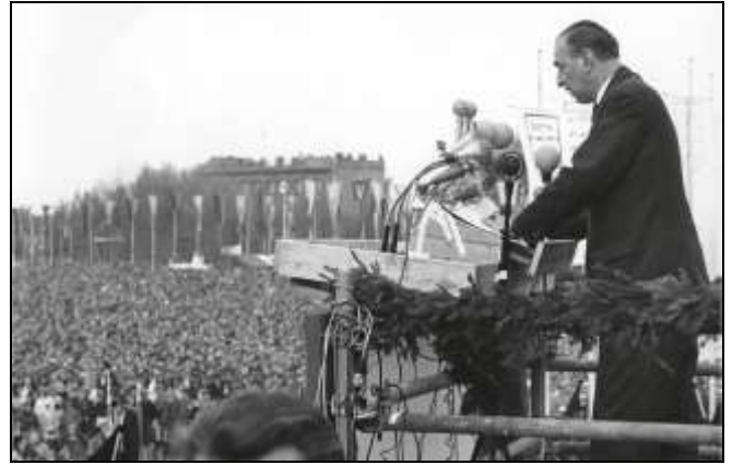
Ludwig Rosenberg als Hauptredner zum 1. Mai 1962 vor dem Reichstagsgebäude in Berlin.

Dennoch: Seine vorgesehene Wahl zum Bundesvorsitzenden des DGB ruft zahlreiche antisemitische Protestschreiben hervor; viele Briefschreiber betonen ihr gewerkschaftliches Engagement. In einem Brief heißt es: „Musste es wieder ein Itzig sein?“ Man benötige „rein deutsche Menschen an der Spitze des DGB“ aber nicht „jene Fremden, die weder zu uns noch zu unserem Volk gehören.“ Für die rechtsradikale Presse der 1960er Jahre war der jüdische Emigrant – er war 1933 nach London emigriert - ein Hauptangriffsobjekt. Auch die KPD-Presse verwendete gezielt antisemitische Kampfbegriffe und spielte mit Verweisen auf den Nationalsozialisten Alfred Rosenberg.