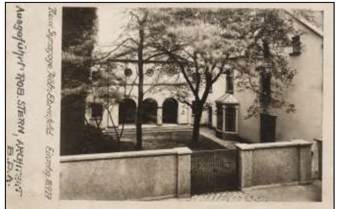
Synagoge an der Köernerstraße vor 1927

Treffpunkt: Wohlfahrtszentrum Ottostr. 85 (Eingang Nussbaumer Str.) Köln-Ehrenfeld Kosten: 8 €, Anmeldung erbeten unter aaron_knappstein@gmx.de