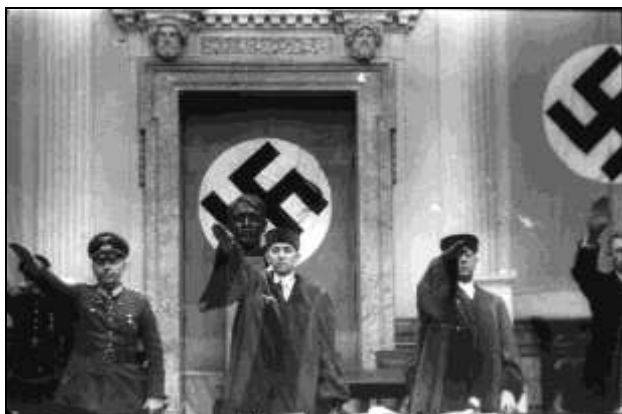
Der Erste Senat des Volksgerichtshofs, Kammergericht Berlin, August 1944

Der Volksgerichtshof wurde 1934 von den Nationalsozialisten zur „Bekämpfung von Staatsfeinden“ geschaffen. Bis Kriegsende mussten sich mehr als 16.700 Menschen vor diesem neuen obersten politischen Gericht verantworten, das ab 1942 jeden zweiten Angeklagten zum Tode verurteilte. Die Ausstellung informiert über die Entstehung und Organisation des Gerichts, beleuchtet am Beispiel von Einzelschicksalen seine Urteilspraxis und informiert über den Umgang mit dem ehemaligen Gerichtspersonal nach 1945.