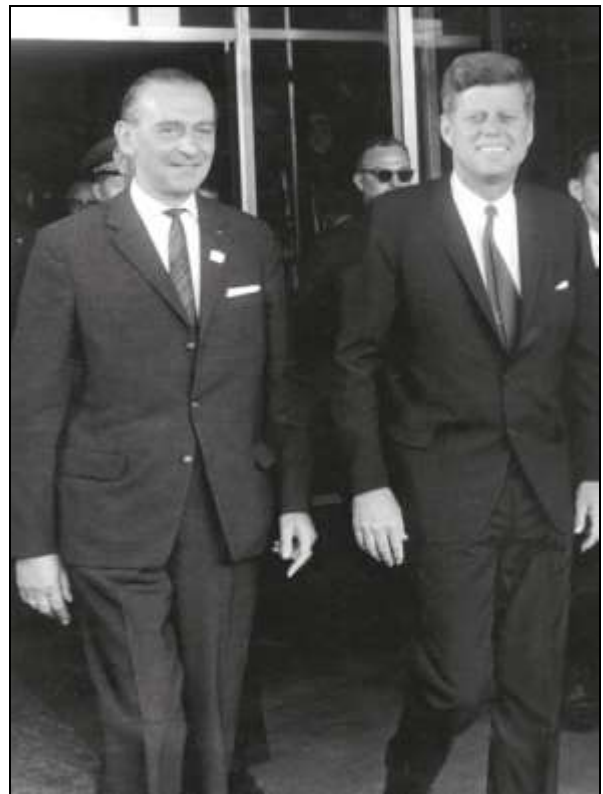
Ludwig Rosenberg und US-Präsident John F. Kennedy betreten am 26.6.1963 die Berliner Kongresshalle, den Tagungsort des Gewerkschaftstags der IG Bau-Steine-Erden.