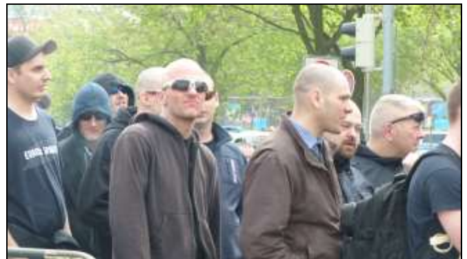
Neonazis auf der unter dem bizarren Motto „Europa erwache“ von „Die Rechte“ am 14.04.2018 in Dortmund