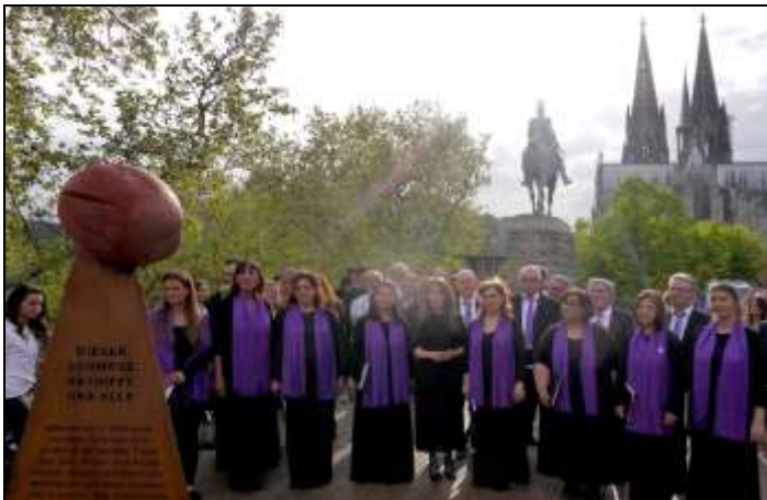
Der Chor der armenischen Gemeinde Köln und des Vereins Silva Kaputikian

Die Gedenkveranstaltung in Köln, organisiert von der Initiative Völkermord erinnern und unterstützt von der Melanchthon-Akademie, dem Verein EL-DE-Haus, dem Jugendclub Courage, dem Katholischen Bildungswerk, dem Lern- und Gedenkort Jawne, dem Verein Silva Kaputikian, von Recherche International, von der armenischen Gemeinde Köln und von KAVOD e.V. - Verein für jüdische Kultur, war in diesem Sinne vorbildlich.