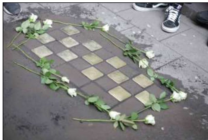
13 Stolpersteine vor Gymnasium Schaurtestraße, Köln-Deutz am 18. März 2019

Historiker, langjähriges Vereinsmitglied, Schriftführer im Vorstand von 1992 bis 1995, stellvertretender Vorsitzender von 1995 bis 2011