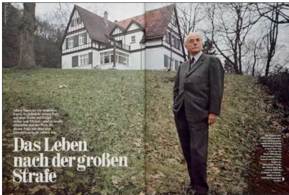
Albert Speer vor seiner Villa in Heidelberg, 1971