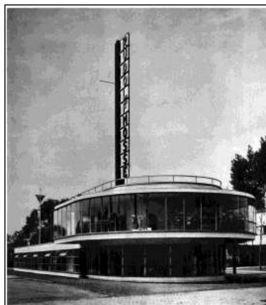
Rudolf-Mosse-Pavillon in Köln. Aus dem Buch: Pressa - Kulturschau am Rhein, Berlin 1928 © unbekannt