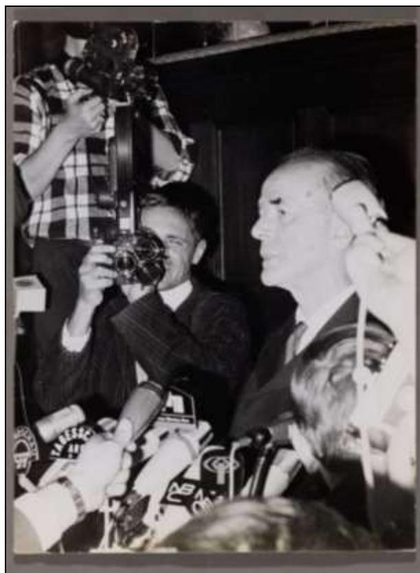
Albert Speer vor Journalisten auf der Pressekonferenz nach seiner Haftentlassung, 1. Oktober 1966.

Eine Ausstellung des Dokumentationszentrums Reichsparteitagsgelände in Kooperation mit dem Institut für Zeitgeschichte, München-Berlin