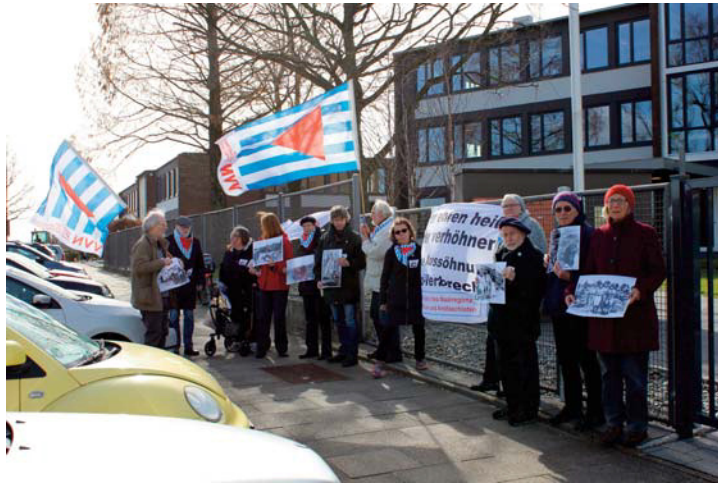
Das Protestschreiben nahm eine Mitarbeiterin entgegen

Lettische Veteranen der Waffen-SS sind am 16.03.2017 erneut in Riga aufmarschiert. Unter Polizeischutz zogen rund 2.000 Faschisten und Sympathisanten durch die Hauptstadt des NATO- und EU-Mitgliedslandes zum Freiheitsdenkmal. Dort legten sie wie in jedem Jahr Blumen nieder. Der auch international unterstützte Gegenprotest ist wiederum von der lettischen Polizei massiv behindert worden. Im letzten Jahr waren zahlreiche deutsche AntifaschistInnen an der lettischen Grenze in Abschiebegefahr genommen und nach einigen Tagen Haft abgeschoben worden. Die Sprecherin der VVN-BdA Cornelia Kerth war bereits in Hamburg von den deutschen Behörden am Flug nach Riga gehindert worden.