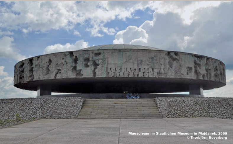
Mausoleum im Staatlichen Museum in Majdanek, 2009