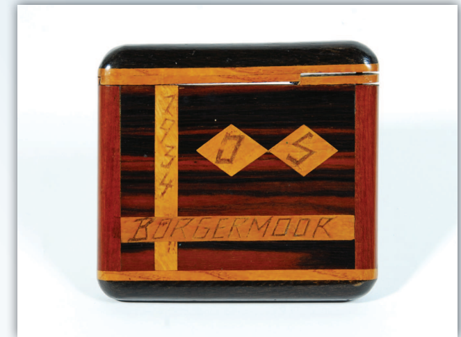
Zigarettenetui aus Holz, angefertigt von Johann Sparwald im KZ Börgermoor 1934

Seminar in Zusammenarbeit mit der Interessengemeinschaft niedersächsischer Gedenkstätten und Initiativen zur Erinnerung an die NS-Verbrechen