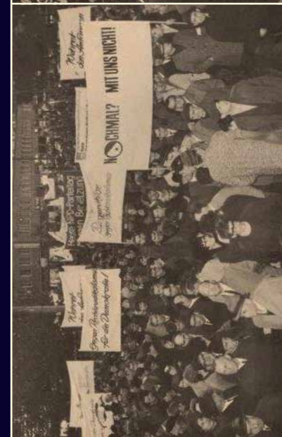
Demonstration gegen den Bundesparteitag der NPD 1966 in Karlsruhe

Tageskonferenz Freitag, 28. November 2014, Leibniz Universität Hannover Veranstaltung aus Anlass des 50. Jahrestages der Gründung der NPD