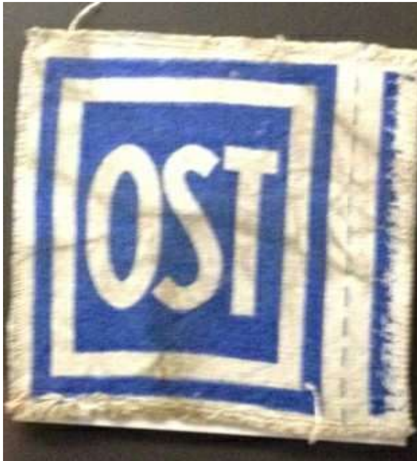
Kennzeichen „OST“ 44 für Zwangsarbeiter*innen aus der Sowjetunion 45

Oder war das sechsjährige Kind „offensichtlich“ ein „Ostarbeiter“, weil „The majority of the people found near Warstein, appeared to have been killed by clubbing. One body of a woman was seen with a bullet hole in the head and two others with bullet holes in the legs.“ 43