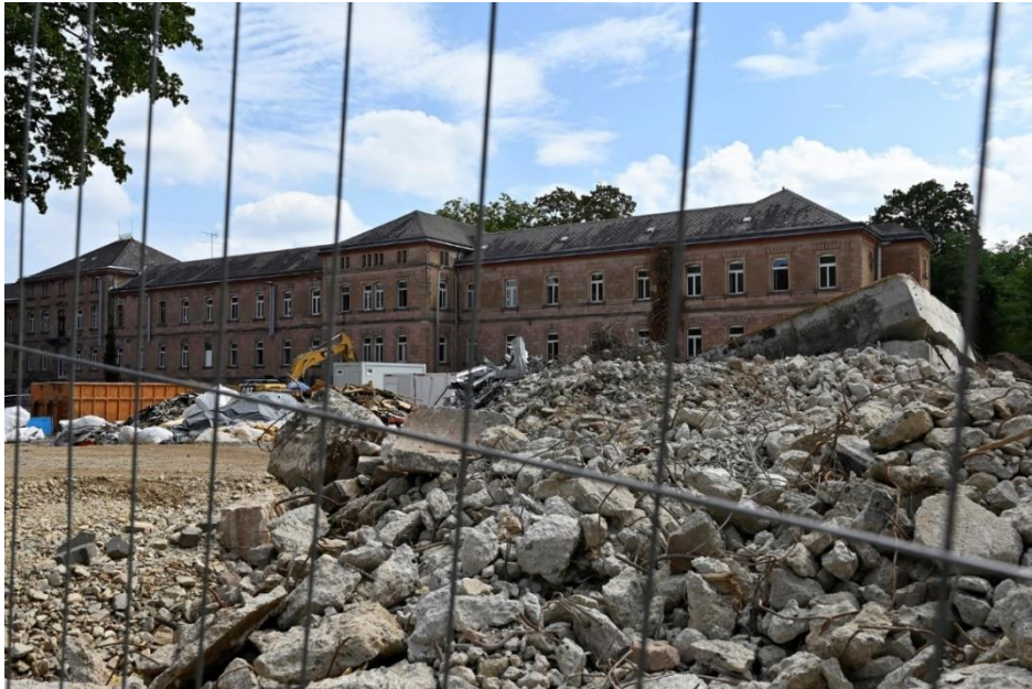
Ein Teil der Nordfassade der ehemaligen „Heil- und Pflegeanstalt“ 2 („HuPfla“) in Erlangen. Der Westflügel wurde schon 2020 abgerissen.

Bitte lesen Sie das Interview von Olaf Przybilla mit Prof. Frewer in der Süddeutschen Zeitung 3 und unterschreiben Sie bitte die Petition gegen den unmittelbar bevorstehenden geplanten Abriß. Bis vor ein paar Tagen hatten viele noch nie etwas davon gehört, und so bitte ich Sie von ganzem Herzen, ganzem Verstand und ganzer Verstand und Seele: Bitte unterschreiben Sie die Petition 4 , denn das ist keine Angelegenheit Bayerns, sondern dieses Bauwerk gehört zu unserer Republik!