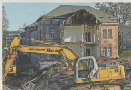
Im abgerissenen Frauenflügel (Vordergrund) der Erlanger Heil- und Pflegeanstalt (oben) waren ebenfalls „Euthanasie“-Opfer untergebracht.

So ist es. Wobei nicht zu bestreiten ist, dass der Mittelteil des Gebäudekomplexes ein ästhetisch schöner Ort ist. Nur geht es in einer „Heilanstalt“ ja nicht um die betreuenden Ärztinnen und Ärzte – sondern um die betroffenen Kranken. Wir können im Männerflügel das furchtbare Geschehen dieses Opferortes bis in die Mikroarchitektur hinein dokumentieren. Für die Geschichte der beschönigend „Euthanasie“ genannten