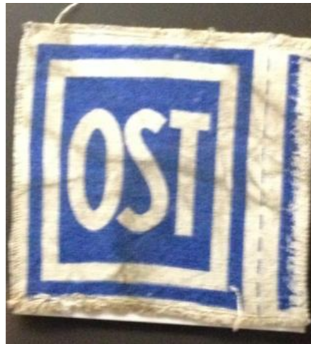
Kennzeichen „OST“ 32

Was steht auf ihrem Grab, dem Grab der „OST“-Arbeiterin bei