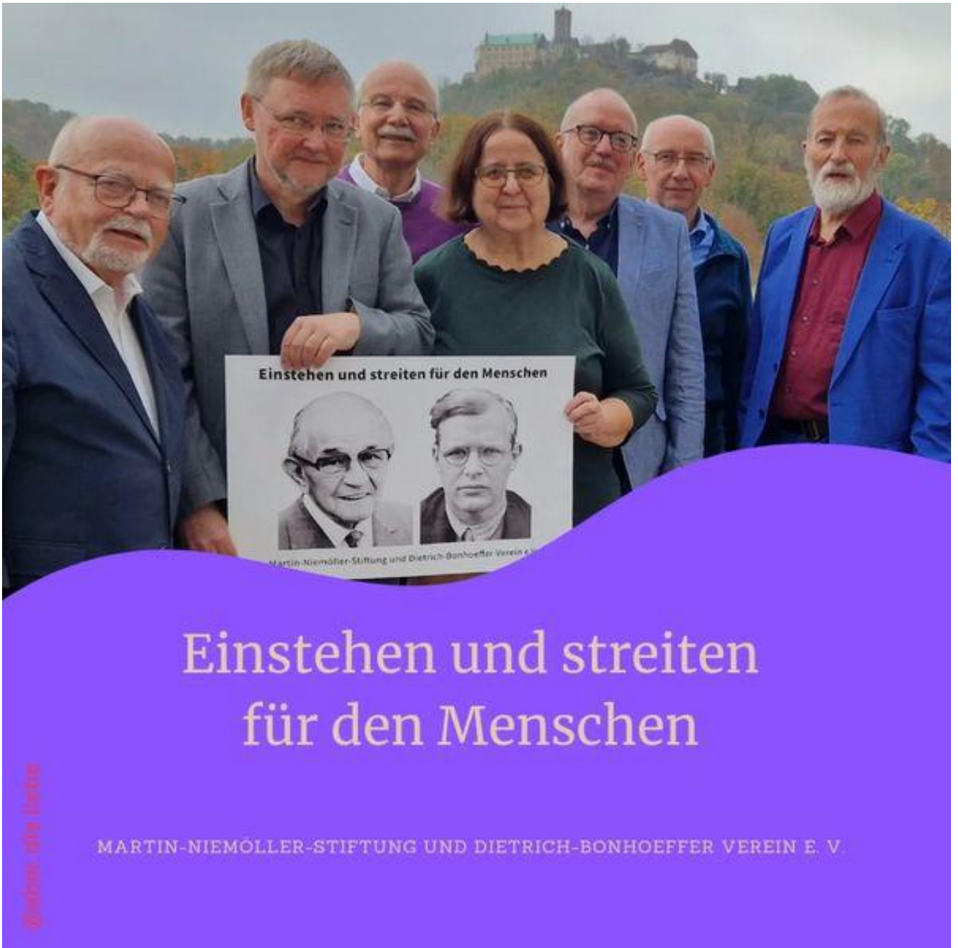
Der neue Vorstand zu Füßen der Wartburg