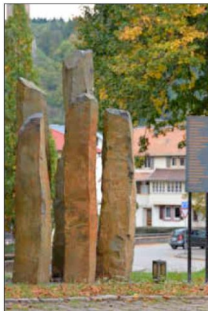
Das Mahnmal für die in Litauen während der NS-Zeit Ermordeten auf dem Kirchplatz.