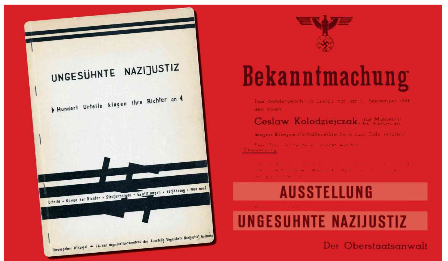
Die Ausstellung war unter anderem in Karlsruhe, Tübingen, Freiburg und Stuttgart zu sehen.

„Der Druck der Verleumdung aus Bonn war damals groß genug, dass die Stadt uns den Mietvertrag für nichtig erklärte.“