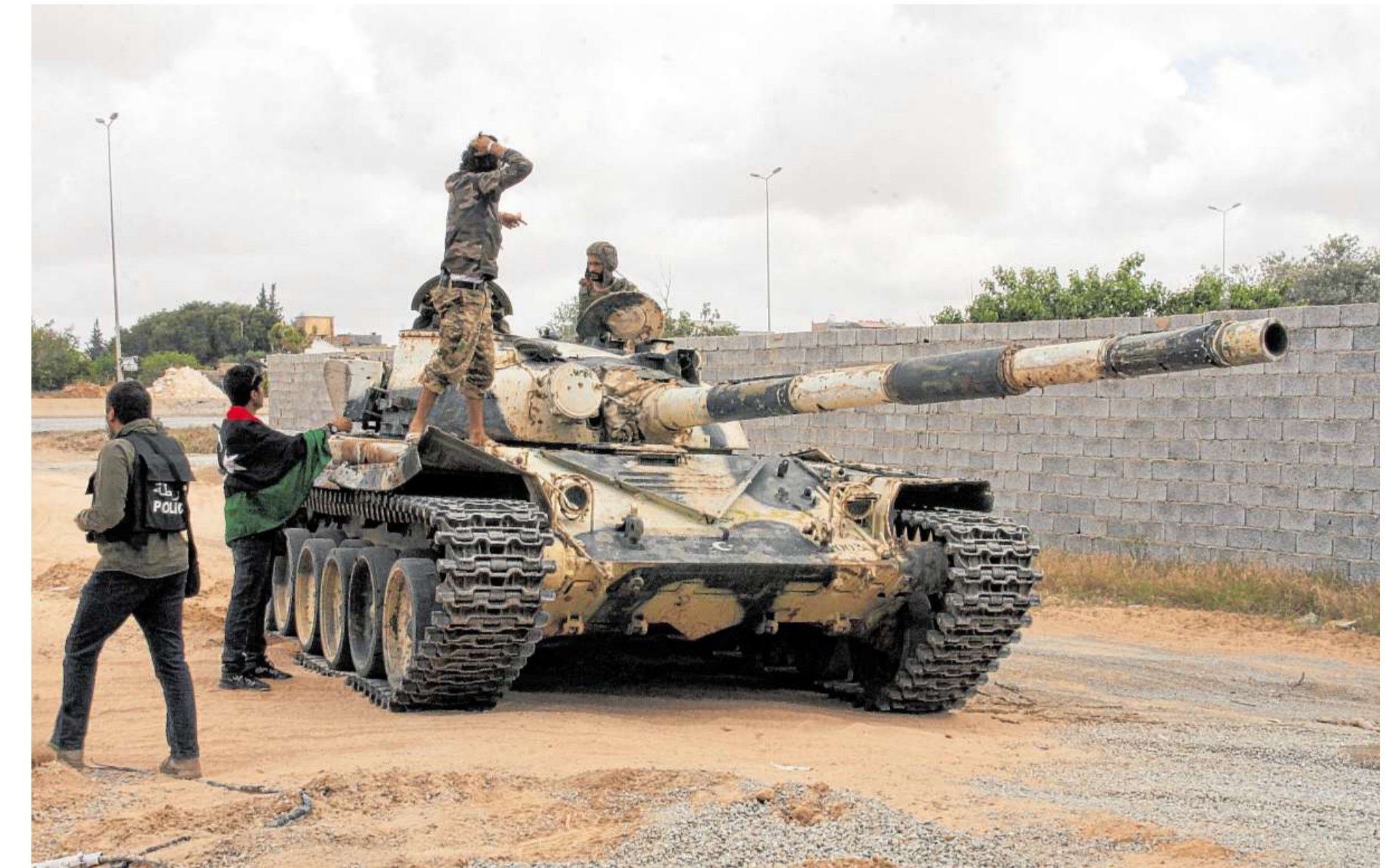
Ein Panzer der international anerkannten Regierung steht auf einer Straße in Tripolis. Die Kämpfe rund um die Hauptstadt hatten sich zuletzt wieder intensiviert.

Drei Wochen später empörte sich UN-Generalsekretär Guterres in New York in einer Wutrede über die anhaltenden Verstöße gegen das Waffenembargo. „Ich bin zutiefst frustriert über das, was in Libyen passiert, und ich finde, es ist ein Skandal“, sagt er. Zweieinhalb Wochen später schmiss auch der UN-Sondergesandte für Libyen, Ghassan Salamé, entnervt hin. Ähnlich ernüchternd