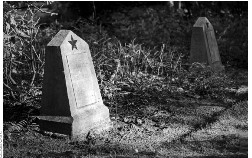
Sowjetische Opfer interessierten in der BRD lange niemand: Grabstein im Stalag 326

Kein Wunder ist es deshalb, dass die riesige Fördersumme auf verkürztem Dienstweg abgesegnet wurde. Die Entscheidung darüber hatte die große Koalition nämlich den sogenannten »Haushaltsbereinigungsverhandlungen« übertragen. Damit war die Schwelle einer sonst üblichen fachwissenschaftlichen Beurteilung de facto umgangen worden. CDU-Kämpfe Elmar Brok, der im Lenkungsausschuss des Projektes mitarbeitete, erklärte Ende Dezember, das »neue« »Stalag 326« solle ein »Mahnmal gegen alle Diktaturen im Europa des 20. Jahrhunderts« werden. Da müssen sich die Aktivistinnen und Aktivisten – bei aller Freude – wohl gehörig sorgen, dass die Blumen für Stukenbrock nicht am Ende auf ganz anderen Gräbern landen.