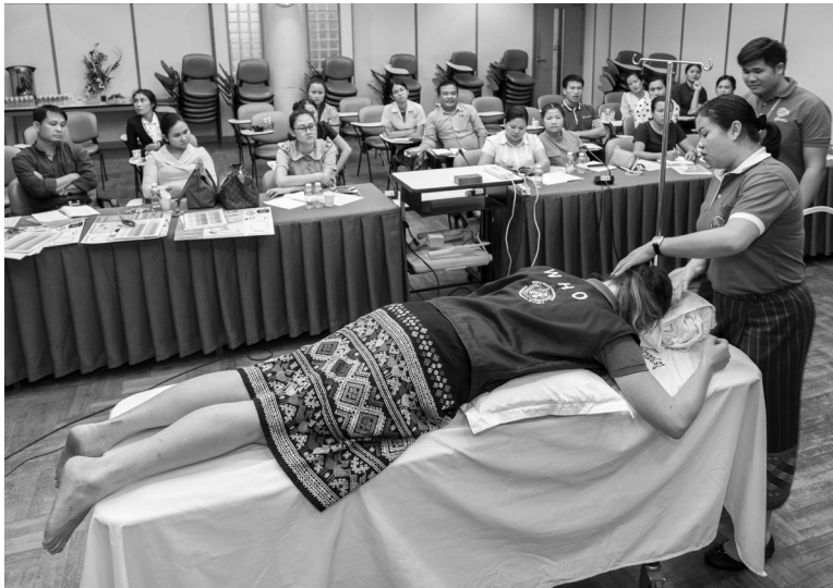
Die Weltgesundheitsorganisation (WHO) schult das medizinische Personal der Intensivstation des Setthathirath-Krankenhauses in Laos in grundlegenden Techniken, um die Notwendigkeit der mechanischen Beatmung von COVID-19-Patientinnen und -Patienten zu verringern.

suchungsversuche nationaler Gesundheitsbehörden zwingen die WHO daher in eine politische Zwickmühle: vor neuen Seuchen zu warnen und staatliche Intransparenz öffentlich anzuprangern, ohne die Kooperation der betroffenen Regierung und damit den Zugang zu Informationen vom Epizentrum einer möglichen Pandemie zu gefährden.