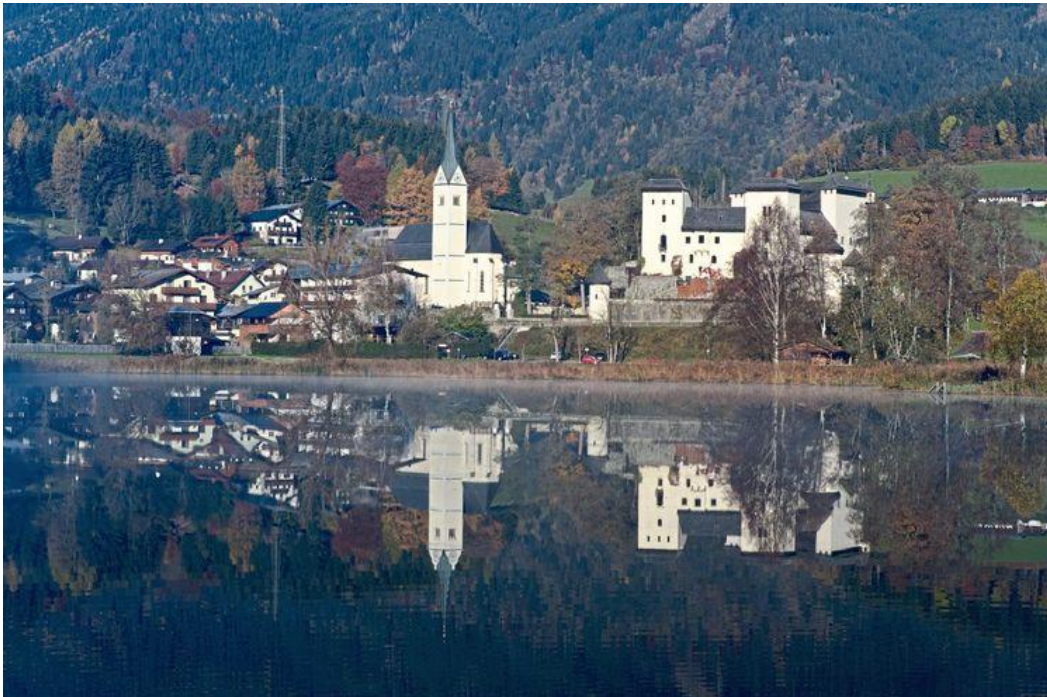
In Goldegg scheint man auf den Widerstand gegen die Nazis nicht stolz zu sein.

Der Mensch hat einen Kopf. Darin kreisen Gedanken. Sie gehören dem Menschen. Sie sind privat. Aus dem Kreisen der Gedanken wird ein Entschluss, zum Beispiel: In diesem ungerechten Angriffskrieg kämpfe ich nicht mit. Die privaten Gedanken führen den Menschen zur Verweigerung einer Pflicht, die ihm der Staat aufzwingt. Der Mensch zieht sich zurück. Er flieht in die Berge. Der Mensch desertiert. Aus privaten Gedanken wird – gleich ob von dem Menschen beabsichtigt oder nicht – politisches Tun oder, wie bei einer Desertion, ein Unterlassen.