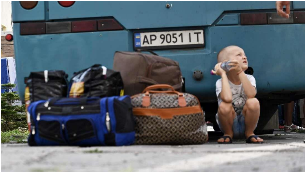
Ein Junge sitzt vor einem Bus am Transitzentrum Ya-Cherson, das die aus der Region Cherson evakuierten Binnenflüchtlinge im Südosten der Ukraine unterstützt.

Mediator und Stiftungsvorstand Gerd Bauz sagt: Verhandeln ist kein Zeichen der Schwäche, sondern der Reife - die Antworten des Pazifismus sind umso gefragter, je länger der Ukraine-Krieg dauert.