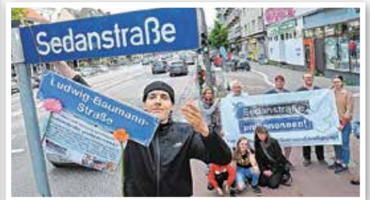
Die Initiative „Sedanstraße umbenennen!“ fordert, dass die Straße künftig den Namen des Deserteurs Ludwig Baumann tragen soll. Symbolisch wurde die Umbenennung schon einmal vollzogen.

danstraße. Eine Umbenennung wäre ein „wahrnehmbar konkretes Zeichen dafür, dass die seinerzeit ausgetragenen Konflikte (1870/71, 1914-1918, 1939-1945), die unsere beiden Nationen entzweit haben, heute nicht mehr Anlass von Spannungen zwischen unseren Völkern sind“.