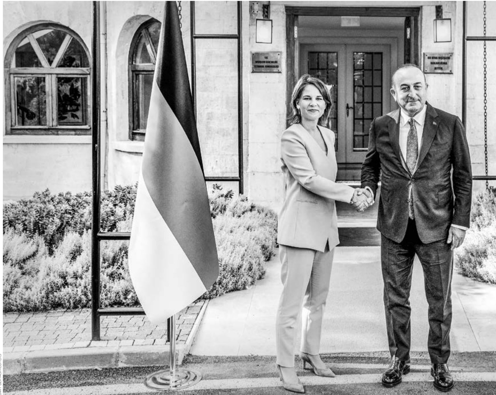
Angesichts der handfesten und sehr konkreten außenpolitischen Interessen der Bundesrepublik erweist sich die Parole von der feministischen Außenpolitik als nachgerade zynisch. Außenministerin Annalena Baerbock mit ihrem türkischen Amtskollegen Mevlut Cavusoglu (Istanbul, 29.7.2022)