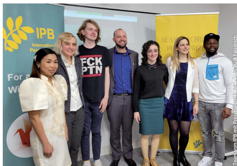
Team von IPB mit Preisträger*innen.

Saša Belik von der Bewegung für Kriegsdienstverweigerung Russland lobt in seiner Rede den Beitrag einiger EU-Länder