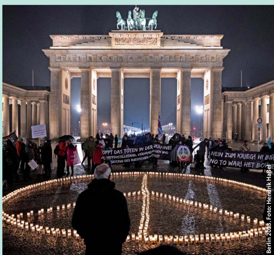
Berlin 2023.