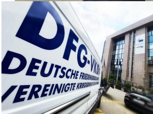
Aktion vor der russischen- und ukrainischen-Botschaft sowie Unterschriftenübergabe am EU-Parlament in Brüssel am 23. Mai 2023.