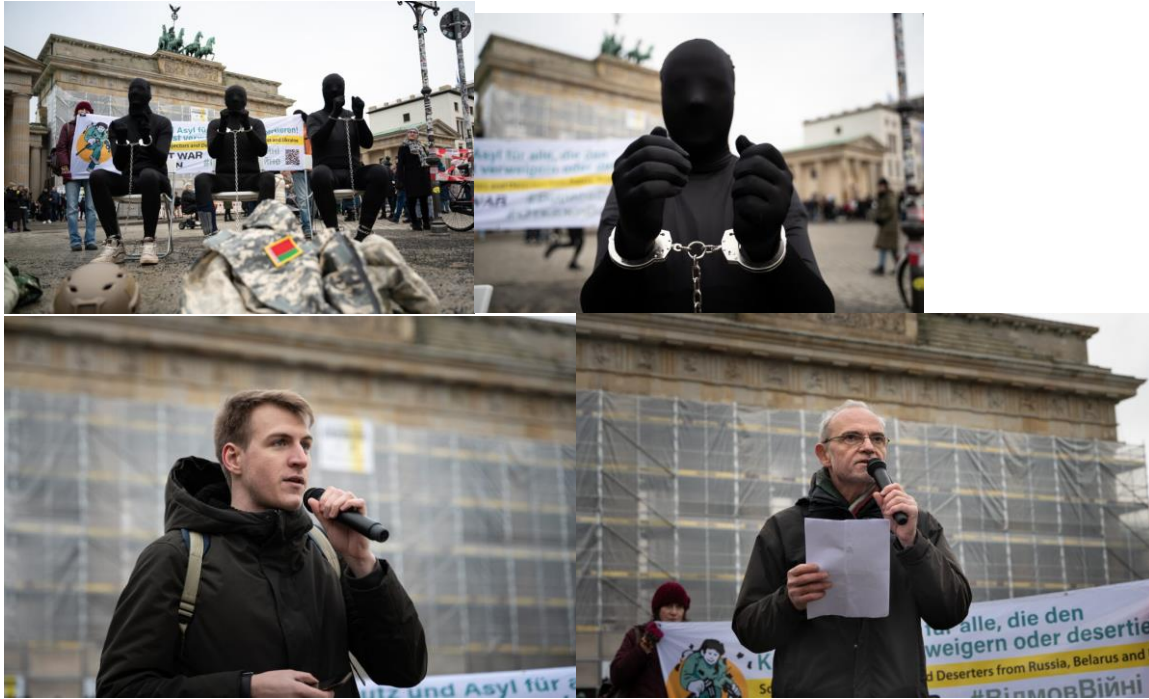
Aktion zum „Internationalen Tag der Menschenrechte“ am 9. Dezember 2023 in Berlin.