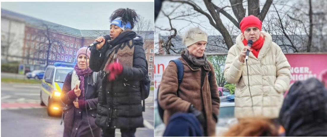
De- monstration zum „Internationalen Tag der Menschenrechte“ am 14. Dezember 2024 zum „Bundesamt für Migration und Flüchtlinge“ in Nürnberg.