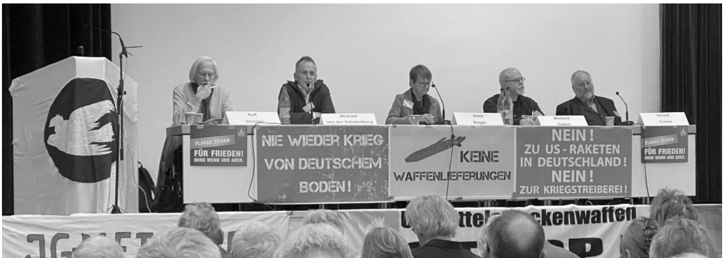
Eröffnungsplenum des Friedensratschlages.