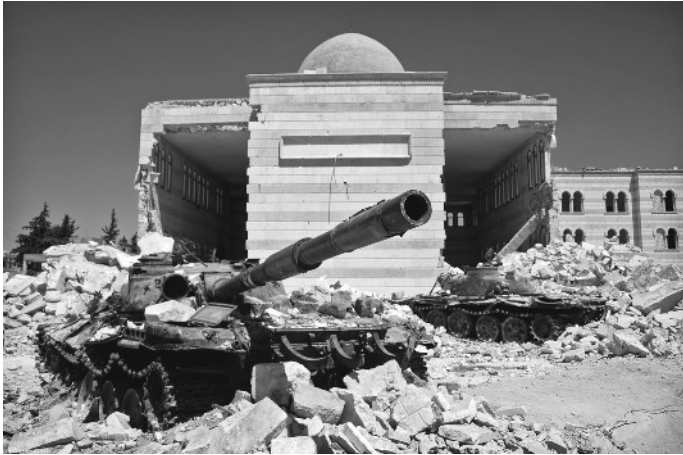
Zerstörte Panzer vor einer Moschee in Azaz, Syrien

Die Einmischung der USA auf Geheiß von Netanjahus rechtsextremer israelischer Regierung hat den Nahen Osten in Schutt und Asche gelegt – mit über einer Million Toten und offenen Kriegen in Libyen, Sudan, Somalia, Libanon, Syrien und Palästina, und mit dem Iran am Rande eines Atomwaffenarsenals.