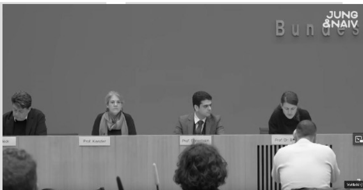
Screenhot aus Videoaufnahme der Bundespressekonferenz.

„die die weitere Vernichtung palästinensischen Lebens durch Israel stoppen. Dazu zählen ein vollständiges Waffenembargo, Sanktionen und die Überprüfung aller diplomatischen, politischen