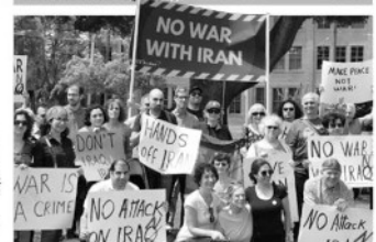
Bild oben: Titelseite des FriedensJournals Nr. 3/2006. Bild unten: ZgK Herbst 2019