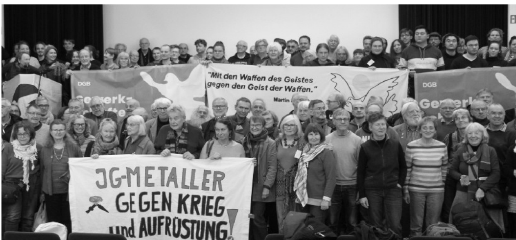
Gruppenfoto der TeilnehmerInnen des Workshops „Gewerkschaften und Friedensbewegung“ beim 31. Friedensratschlag. Ein Bericht darüber findet sich auf der Homepage https://friedensratschlag.de

Der informelle Austausch am Ratschlag, bei dem auch auf zahlreiche regionale und lokale Aktivitäten verwiesen wurde, führte zu der optimistischen Grundstimmung, dass mit einer stärkeren Mobilisierung zu rechnen ist.