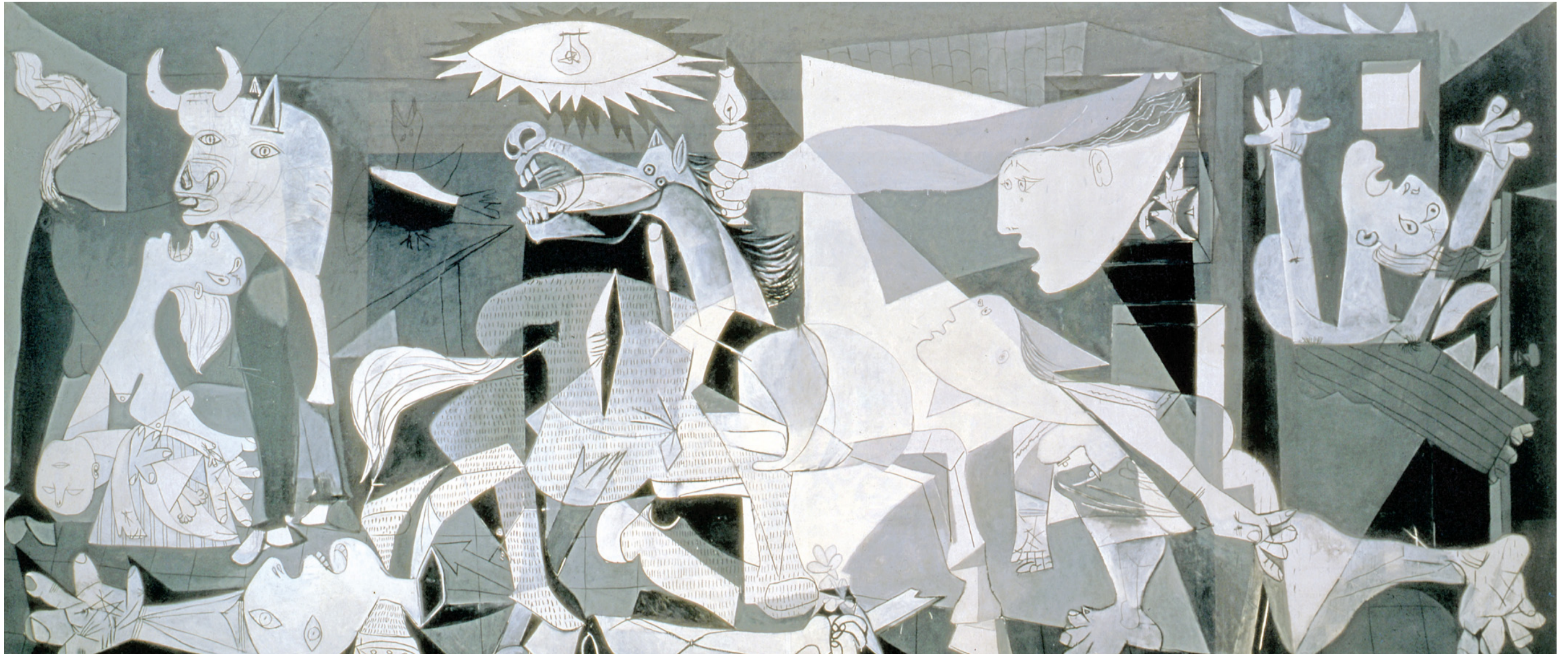
Anklage gegen Krieg und Zerstörung: „Guernica“, eines der bekanntesten Gemälde Pablo Picassos, erinnert an die Zerstörung der Stadt Gernika durch deutsche und italienische Luftwaffen-Einheiten im spanischen Bürgerkrieg.