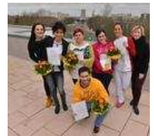
Pflegekräfte aus Spanien und Polen fit für den J