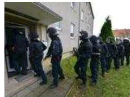
Polizei trainiert Hauserstürmung