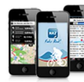
Fahr Rad! - Die App