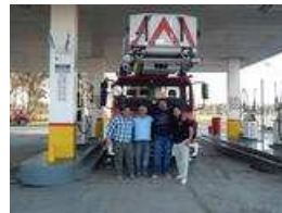
Drehleiter wartet in Argentinien auf ersten Einsatz