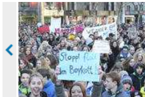
Demo beeinträchtigt Unterricht kaum