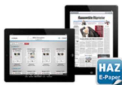
Die HAZ E-Paper App