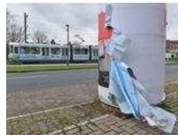
Wetter zieht Plakate in Mitleidenschaft