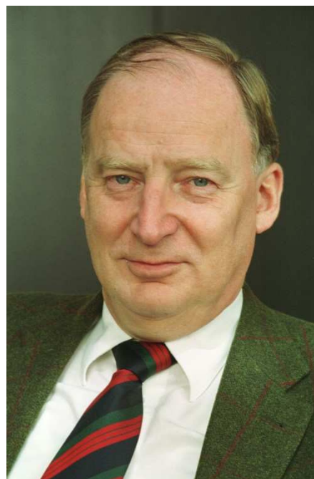
Dr. Alexander Gauland im Tagesspiegel : "Die Deutschen haben ein gestörtes Verhältnis zur militärischen Gewalt."

Dr. Gauland ist bekanntermaßen ein sehr belesener Theoretiker des Konservatismus mit zahlreichen, von mir geschätzten einschlägigen Publikationen: z.B. Das Legitimitätsprinzip in der Staatenpraxis seit dem Wiener Kongress (1971), Was ist Konservatismus? (1991) und Anleitung zum Konservativsein (2002). Er sieht sich in der Tradition von Edmund Burke, der – selbst aktiver Politiker im England des ausgehenden 18. Jahrhunderts – weltweit zu Recht als theoretischer Stammvater der gehaltvollen konservativen Kritik an der französischen Revolution von 1789 gerühmt wird. Für Alexander Gauland enthält das Denken Edmund Burkes „Elemente, die für eine heutige politische Orientierung brauchbar sind“. Es geht ihm um ein spezifisches Menschen- und Gesellschaftsbild, das „in einer skeptischen Anthropologie, in der Gegnerschaft gegen den liberalen Individualismus wie einem autoritären Kollektivismus und in einer grundsätzlichen Skepsis gegenüber der Fortschrittsdynamik der Moderne“ wurzelt.