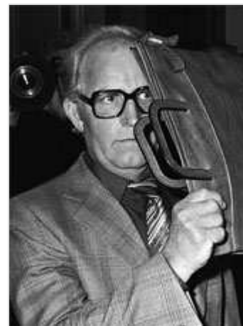
Siert Bruins bei seiner Ankunft vor dem Hagener Gerichtsgebäude im Jahr 1979

Zu einem früheren Zeitpunkt sagte Bruins über seine Tätigkeit bei der Waffen-SS: „Ich bedaure nicht, was ich im Krieg getan habe und ich habe keine Sekunde deswegen wach gelegen. Es wurde mir durch meine Vorgesetzten aufgetragen. Es war meine Arbeit.“ Bislang hatte man angenommen, dass Bruins der letzte noch lebende Niederländer sei, der sich für ein Verbrechen während des Zweiten Weltkriegs verantworten muss, da andere niederländische Kriegsverbrecher inzwischen verurteilt oder verstorben sind. Die Liste, laut derer Bruins der letzte niederländische