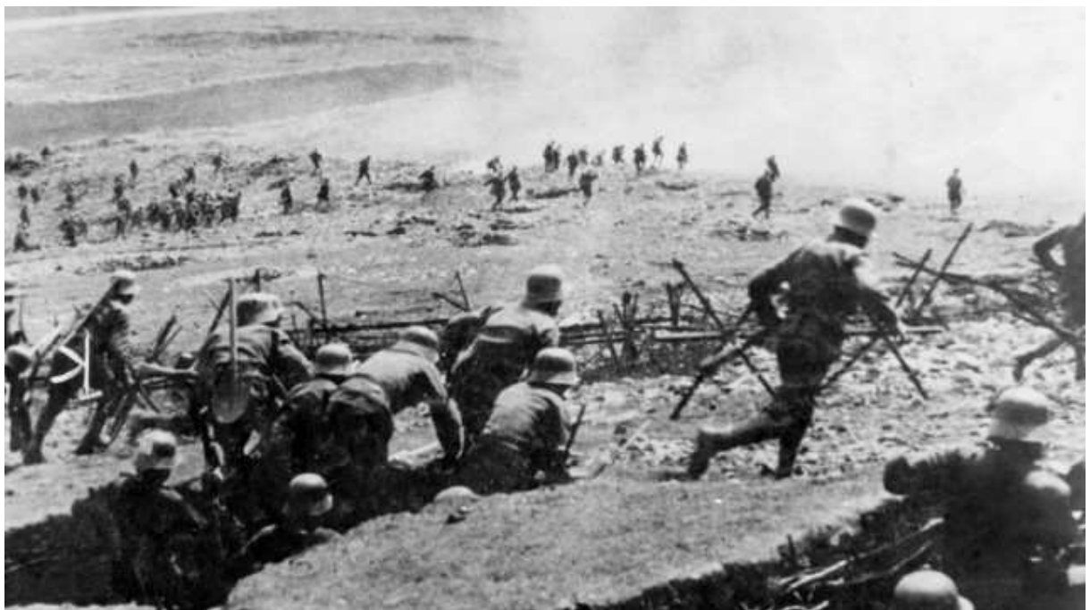
Sturmangriff österreichisch-ungarischer Truppen auf eine italienische Stellung bei einer Isonzo-Schlacht im Jahre 1916

Nur einer Minderheit war bekannt, dass Kanada, Australien, Neuseeland, Indien und schließlich die USA auch noch am Krieg gegen die Mittelmächte beteiligt waren, oder dass der Krieg auch in Masuren und Galizien, auf dem Balkan, in den Dolomiten oder in Afrika tobte. Einer von der BBC durchgeführten Meinungsumfrage zufolge halten gegenwärtig 55 Prozent der Briten den Kriegseintritt 1914 für gerechtfertigt, 38 Prozent erklärten ihn für eine Fehlentscheidung.