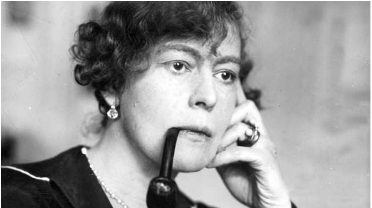
Mechtilde von Lichnowsky in der Zwischenkriegszeit.

Als der amerikanische Botschafter Walter Page am Nachmittag des 4. August 1914 in London zur deutschen Botschaft fuhr, um für die Dauer des Krieges die Geschäfte des Deutschen Reiches zu übernehmen, fand er den Fürsten Lichnowsky wie einen Gebrochenen im Schlafanzug herumirrend vor.