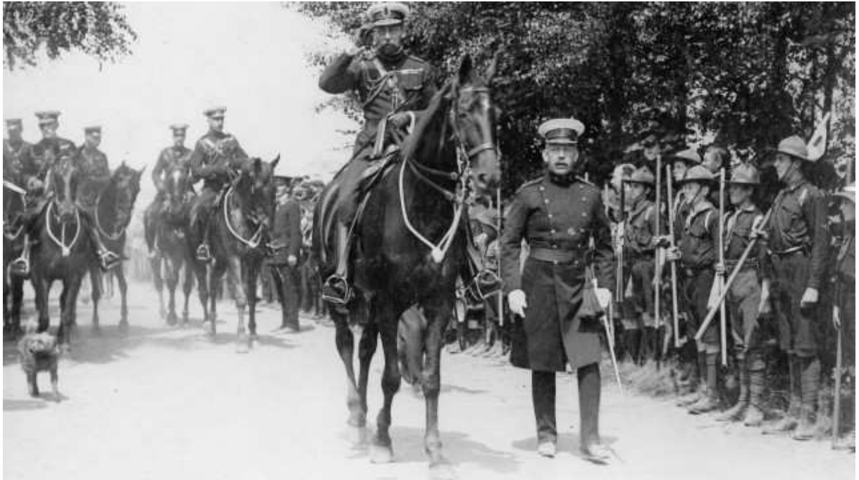
Der britische König (hoch zu Ross) mit Pfadfindern im Jahre 1910.

Aber diese Befürchtungen wurden auf Grund einer fatalen Mitteilung des Prinzen Heinrich von Preußen in den Wind geschlagen. Wie schon Anfang Dezember 1912 hatte Wilhelm II. auch jetzt wieder seinen Bruder nach London entsandt, um herauszuhören, wie die britische Haltung im Falle eines Krieges auf dem Kontinent ausfallen würde.