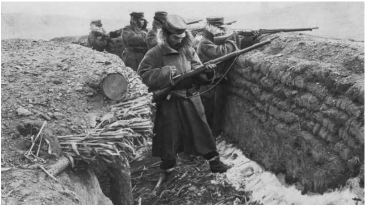
Japanische Soldaten in einer Stellung in der Mandschurei während des Russisch-Japanischen Krieges 1904/1905.

Mit dem Ausbruch der Balkankriege im Herbst 1912 änderte sich die deutsche Kriegsplanung grundlegend. Aufgeschreckt durch die Aussichtslosigkeit eines Seekrieges gegen die Supermacht England setzte Reichskanzler Theobald von Bethmann Hollweg in Verbindung mit der Armee und gegen Admiral von Tirpitz eine Umorientierung der deutschen Strategie durch: statt wie bisher einen Krieg gegen Frankreich und erforderlichenfalls auch gegen Großbritannien in der Annahme der russischen Neutralität ins Auge zu fassen, bereitete man sich nun auf einen Krieg gegen Frankreich und Russland in der Hoffnung auf die englische Neutralität vor. "Um gegen Moskau marschieren zu können, muss erst Paris genommen werden", erklärte der Kaiser im November 1912.