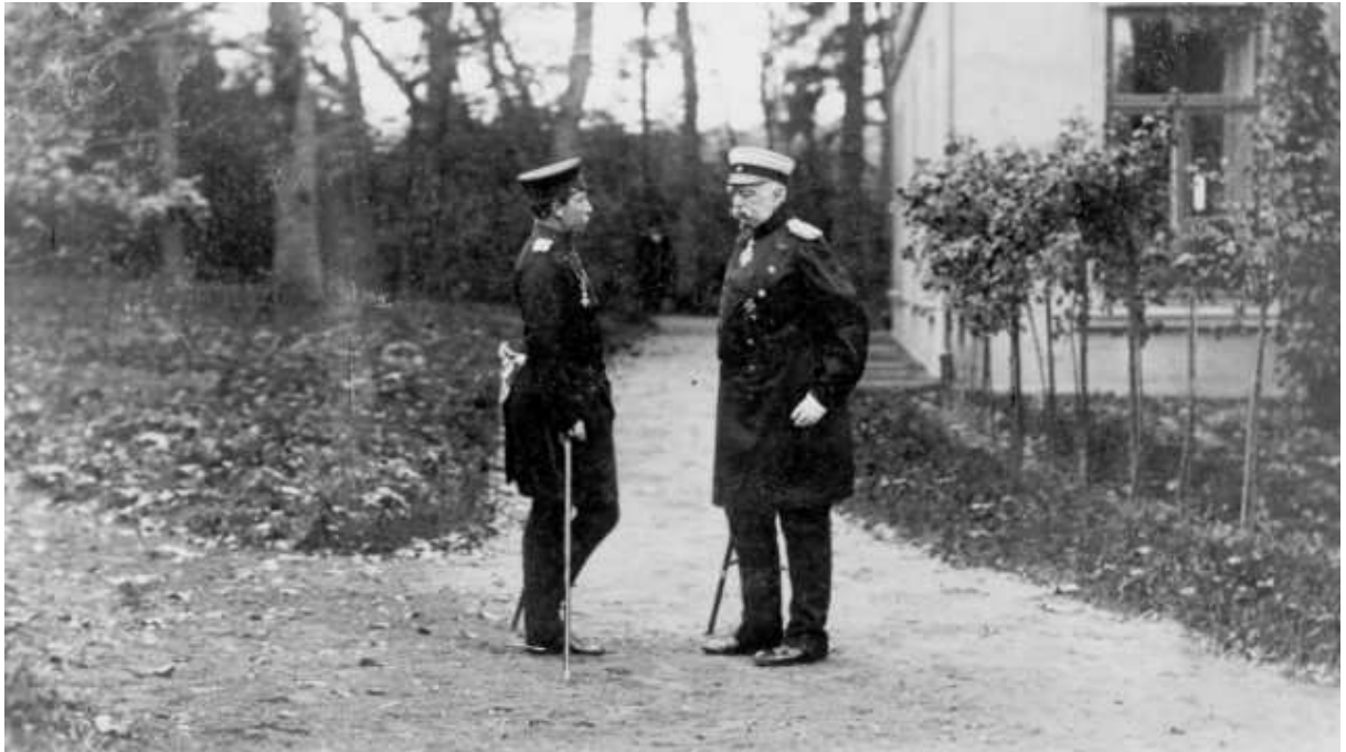
Nicht auf einer Wellenlänge: Wilhelm II. (li) und der alte Reichskanzler Otto von Bismarck im Park von Schloss Friedrichruh im Jahre 1888, dem Jahr, in welchem der selbstherrliche junge Kaiser den Thron bestieg.

Das wirtschaftlich, demografisch und kulturell beispiellos erfolgreiche Reich preschte nach vorne, und das Streben nach dem Status einer "Weltmacht" auf Augenhöhe mit den aufsteigenden Vereinigten Staaten von Amerika im Westen und der von Wilhelm II. als "Gelbe Gefahr" verunglimpften Mächte im Osten brachte das Kaiserreich unweigerlich in den Konflikt mit dem "europäischen Konzert" - dem Staatensystem des Wiener Kongresses, welches letztendlich durch die Gleichgewichtspolitik Großbritanniens aufrechterhalten wurde.