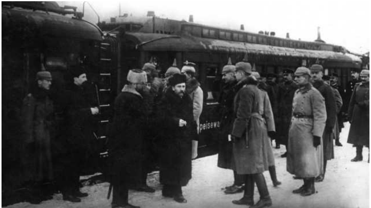
Empfang der russischen Delegation für die Verhandlungen über einen Waffenstillstand auf dem Bahnhof von Brest-Litowsk durch deutsche Offiziere im Jahre 1917.

Als Pendant käme ein zusammenhängendes mittelafrikanisches Kolonialreich unter Einschluss des Kongo hinzu. In seinem Buch Griff nach der Weltmacht konnte Fischer belegen, dass diese Ziele im Verlauf des Krieges grundsätzlich gleichgeblieben sind, ja, im Osten sind sie teilweise durchgesetzt worden, als Trotzki im März 1918 den Diktatfrieden von Brest-Litowsk unterzeichnete.