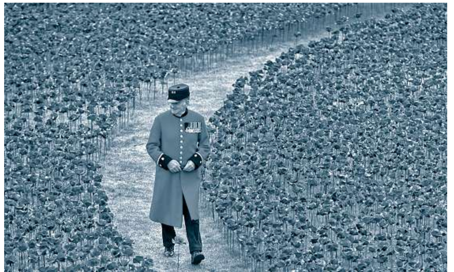
Ein Denkmal mit 888 246 Mohnblumen aus Keramik erinnert in London an den Ersten Weltkrieg – für jeden britischen Gefallenen eine.