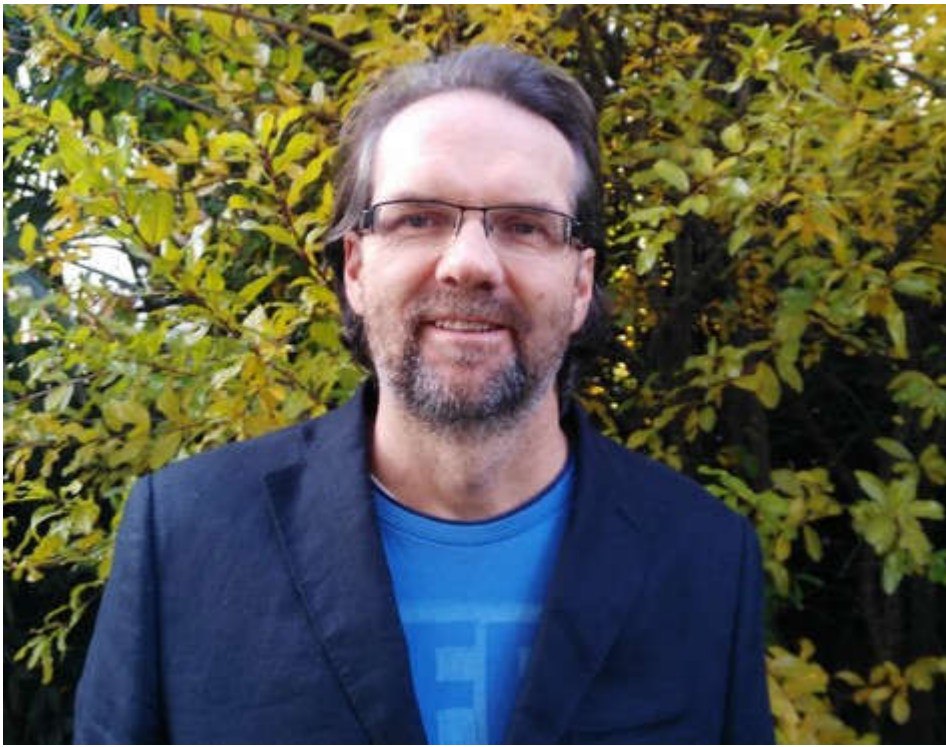
Walter Pichler interviewte Anfang der 1990er Jahre zahlreiche ehemalige Deserteure.

STOL hat mit dem Südtiroler Historiker und Geschichtsdidaktiker Walter Pichler über das langjährige Tabuthema Desertion gesprochen.