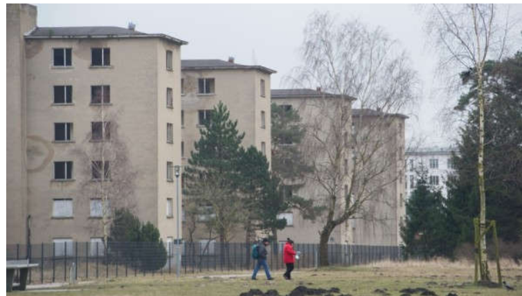
Blick auf den Block 5 des denkmalgeschützten Komplexes Prora