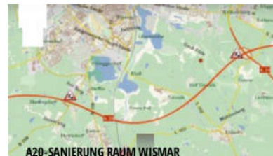
A20-SANIERUNG RAUM WISMAR

Bisher fünf Demonstrationen in der Landeshauptstadt angemeldet ... MEHR