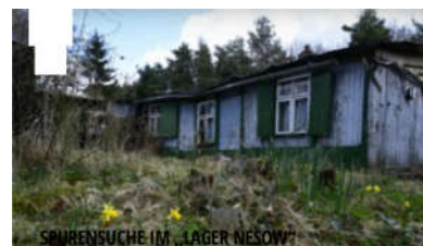
SPURENSUCHE IM „LAGER NESOW“