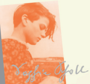
Plakat der aktuellen Wanderausstellung der Weiße-Rose-Stiftung