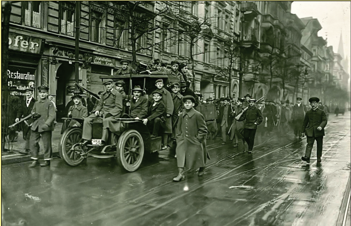
„ZERSCHOSSEN, ZERSTOCHEN, ZERTRAMPELT“ (K. Retzlaw)

Die Nachbarschaftsinitiative „ Dragopolis “ und die „ Initiative Gedenkort Januaraufstand “ laden zu einer Lesung mit Musik und begleitender Ausstellung ein, um an die zentrale Bedeutung der Dragonerkaserne während des Januaraufstandes 1919 und an die am 11.01.1919 hier ermordeten sieben Parlamentäre aus dem besetzten Vorwärtsgebäude zu erinnern.