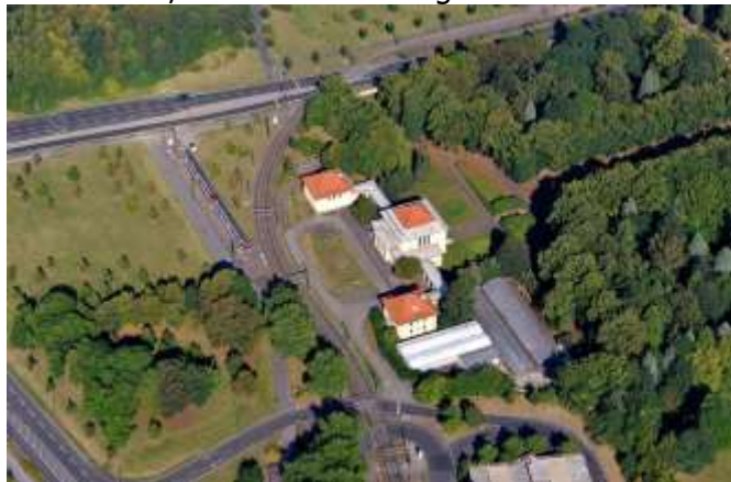
Bocklemünd aus der Luft: Jüdischer Friedhof, 2009

Anmeldung bis: 26. Juli 2016 über www.nsdok.de , Link aktuell, Link Veranstaltungen