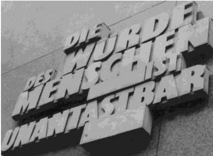
Den Schriftzug ließ Fritz Bauer am Landgericht Frankfurt anbringen.

Fritz Bauer selbst wurde im NS-Staat als Sozialdemokrat und Jude ausgegrenzt und verfolgt. Er rettete sich in die Emigration, zunächst nach Dänemark, dann nach Schweden. Auch im Exil setzt er sein politisches Engagement fort. Nach Ende des Zweiten Weltkriegs kehrte Fritz Bauer nach Deutschland zurück und wurde zu einem der bedeutendsten und juristisch einflussreichsten jüdischen Remigranten im Nachkriegsdeutschland. Die Ausstellung dokumentiert sein Leben und Wirken im Spiegel der Geschichte.