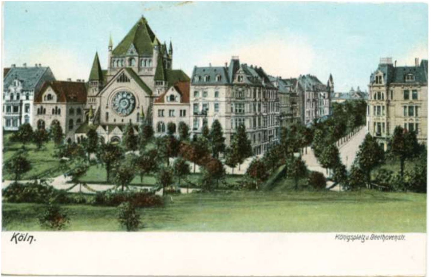
Synagoge am früheren Königsplatz