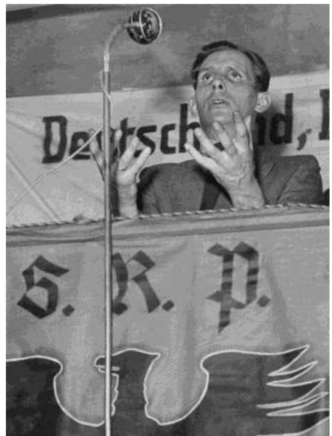
Der ehemalige Wehrmachtsoffizier Otto Ernst Remer, Sozialistische Reichspartei, 1950