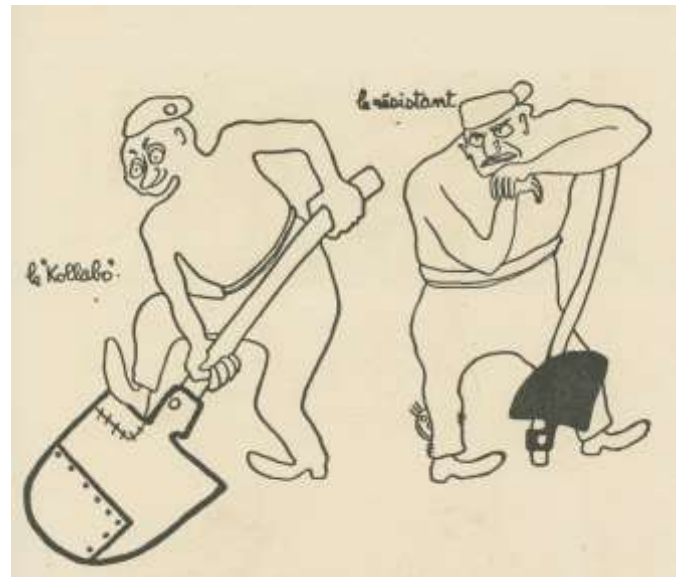
Der „Kollaborateur“ und der Widerstandsaktivist © Charrin

Charrin war nicht nur ein begabter Karikaturist. Seinen Skizzenblock – ein treuer Begleiter während seiner Zwangsarbeit – füllte er mit zahllosen Zeichnungen. Die künstlerische Auseinandersetzung mit seiner Lebenssituation war eine Überlebenshilfe für ihn. Mit einem Blick für die Eigenheiten der Menschen, mit spitzer Feder und einer großen Portion Humor hielt er in seinem Skizzenblock die Lebenswelt der Zwangsarbeiter fest und karikierte die österreichischen Vorarbeiter.