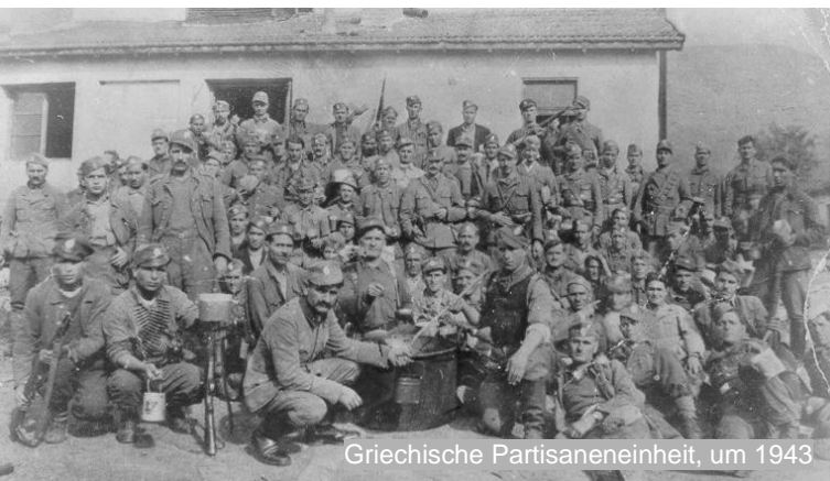
Griechische Partisaneneinheit, um 1943