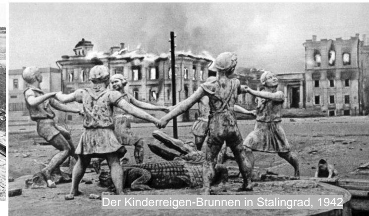
Der Kinderreigen-Brunnen in Stalingrad, 1942

Mit dem sog. Anschluss Österreichs im März 1938 begann die Ausbreitung des faschistischen Deutschland in Europa. Mit dem Überfall auf Polen am 1. September 1939 ging sie in die offene kriegerische Phase.