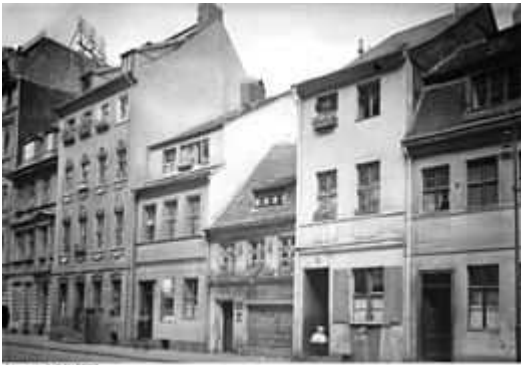
Der erste Standort des Anti-Kriegs-Museums in der Parochialstraße 29 (Bildmitte bzw. dritter Hauseingang von rechts) im Jahr 1930

Ausgangspunkt des Spazierganges war der historische Ort des Antikriegsmuseums in Mitte (1923) von Ernst Friedrich, das für die "Ostgründung" Pate stand. Seit 2002 hängt nach jahrelangem Mühen der FB/AK eine Gedenktafel an der Stelle in der Häuserfront in der Parochialstrasse 1-3 dem heutigen Standesamt Mitte, wo das kleine Häuschen stand.